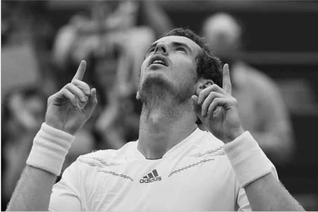
ენდი მარიმ ერთეულთა რეიტინგში მესამეა