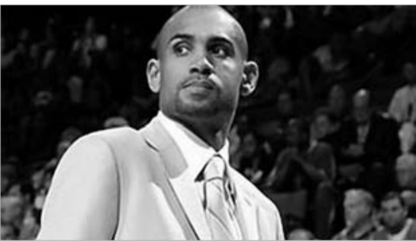
გრანტ ჰილისთვის პირველ ადგილზე კალათბურთი რჩება

- NBA-ში თამაში 1995 წელს დაიწყო და სადებიუტო სეზონში "ოლსტარში" მოხვდით. მიღებული ხმების მიხედვით, დემიურტანტებისთვის რეკორდულ დაამყარეთ. მას შემდეგ თითქმის 18 წელი გავიდა. რა შეიცვალა ლიგაში?