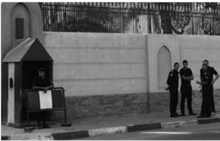
კარიკატურის საფრანგეთის საელჩოსთან დაცვა დააყენეს

ყოველკვირეული გამოცემის ნომერი კი გუშინ თაროებზე გამოჩენისთანავე უმოკლეს დროში გაიყიდა. ჟურნალის თავფურცელზე გამოსახული იყო ტირიანიანი გამოცემის მფლობელი მუსლიმი, რომელიც შეზღუდული შესაძლებლობების მქონე პირის ეტლში იჯდა და ორთოდოქს იუდეველს მიჰყავდა. ილუსტრაცია დასათავსებული იყო სახელწოდებით "ხელშეუხებელი 2" და ერიკ ტოლენდნოსა და ოლივიე ნაკაშის ფილმის "ხელშეუხებლების" ალუზიას წარმოადგენდა. რაც შეეხება ჟურნალის შიდა