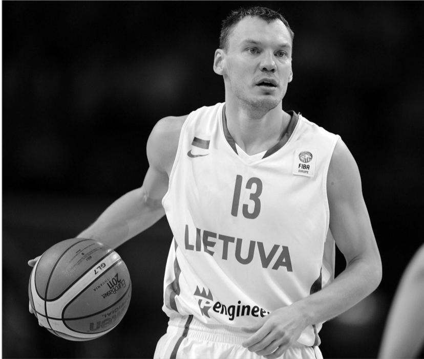
შარუნას იასიკიავიჩუსი "ბარსელონაში" დაბრუნდა

5 მარტს შარუნას იასიკიავიჩუსი 36 წლის გახდა. ლეგენდარული პერსონაჟის კარგი, დამსახურებული ასაკი. იასიკიავიჩუსი ევრობასკეტში მარადონაა. ბევრს მოგზაურობს, ბევრს იგებს, ბევრს ნიკვინებს და, ძირითადად, იგებს. შარუნასმა ვერ ისწავლა გულშემატკივრებთან, ბოსეებთან საუბარი და მაინც სერიოზულ კუშს უხდიან. ინტელექტუალმა პირველმა ნომერმა ეს ნამდვილად დაიმსახურა. ახალ სეზონში ბიჭი "ბარსელონაში" იქნება. ნარსულში დაბრუნდება.