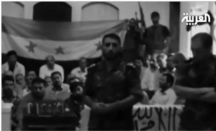
ირანელი მომლოცველები ამბოხებულების ხელში

რეზოლუციას ხმა მისცა 133-მა სახელმწიფომ, 12 წინააღმდეგი იყო და 31-მა თავი შეიკავა. ამ დოკუმენტს, უშიშროების საბჭოს მიერ მიღებული რეზოლუციების-