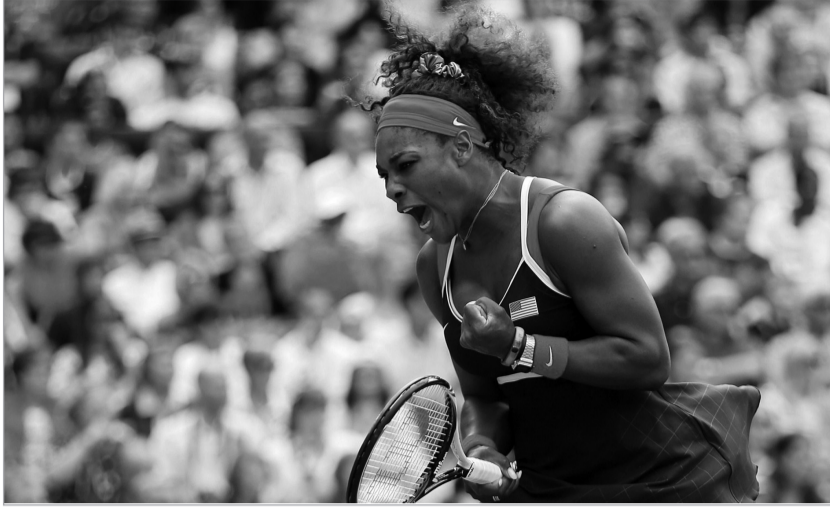
ოლიმპიური ჩემპიონი სერენა უილიამსი

ბურთია და შარაპოვა - პოდიუმი. მომენტებში პოდიუმიც ჩოგბურთს თამაშობს, მაგრამ უილიამსი სხვა ლიგაა. იქ სერენა და დედოფლის დაქალები ნარდს უბერავენ და იქ "ფერარით" მისვლა ცუდი ტონია. მხოლოდ "ბენტლი" ან "როლს როისი". პირადი დაცვა "ასტონ მარტინით" გრიალებს და პიჟონები ვერ პიჟონობენ. სერენა ჩოგბურთის როიალური ოჯახის წევრია. იმ ოჯახში არიან შტეფი, სერ მარტინა ნავრატილოვა, მისის კრის ევერტი (ლოიდის გარეშე), ჰელენ უილს მუდი და ბილი ჯინ კინგი. სადღაც იქვე არიან მარია ბუენო, სიუზან ლენგლენი და სერენას ელეგანტური დაიკო, ვენუსი. შარაპოვა მეორე ემელონია. თუ შტეფის ან