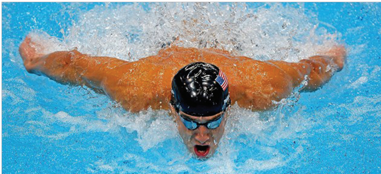
ლეგენდარული მაიკლ ფელსი

ლონდონის ოლიმპიურ თამაშებზე ასპარეზობა დაასრულა სიცოცხლეშივე ლეგენდად ქცეულმა მოცურავემ მაიკლ ფელსმა. ათენსა და პეკინში მოგებულ 14 ოქროს მაიკლმა ლონდონში კიდევ ოთხი დაუმატა. მან ყველა შესაძლო რეკორდი მოხსნა. ოლიმპიური თამაშების ისტორიაში ის ყველაზე ტიტულოვანი სპორტსმენია. საერთო ჯამში ფელსს 22 მედალი აქვს მოგებული, აქედან 18 ოქრო, 2-2 ვერცხლი და ბრინჯაო. საეჭვოა, რომ უახლოეს მომავალში ასეთი შედეგი ვინმემ აჩვენოს.