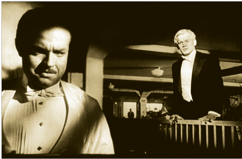
კარდი ფილმიდან "მოქალაქე კინი"

ნი" ჯონ ფორდი და მისი ვესტერნის ჟანრის კლასიკად აღიარებული "მაძიებლები". მომდევნო ადგილზე საბჭოთა და მსოფლიო კინემატოგრაფის შედეგად მიჩნეული, ერთ-ერთი პირველი ექსპერიმენტული დოკუმენტური ფილმი "ადამიანი კინოკამერით" (1929) გავიდა. მას კარლ დრეიერის 1928 წლის "ჟანა დ'არკის ვენბანი" მოსდევს, ხოლო პირველ ათეულს ფედერიკო ფელინის "8 1/2" ასრულებს.