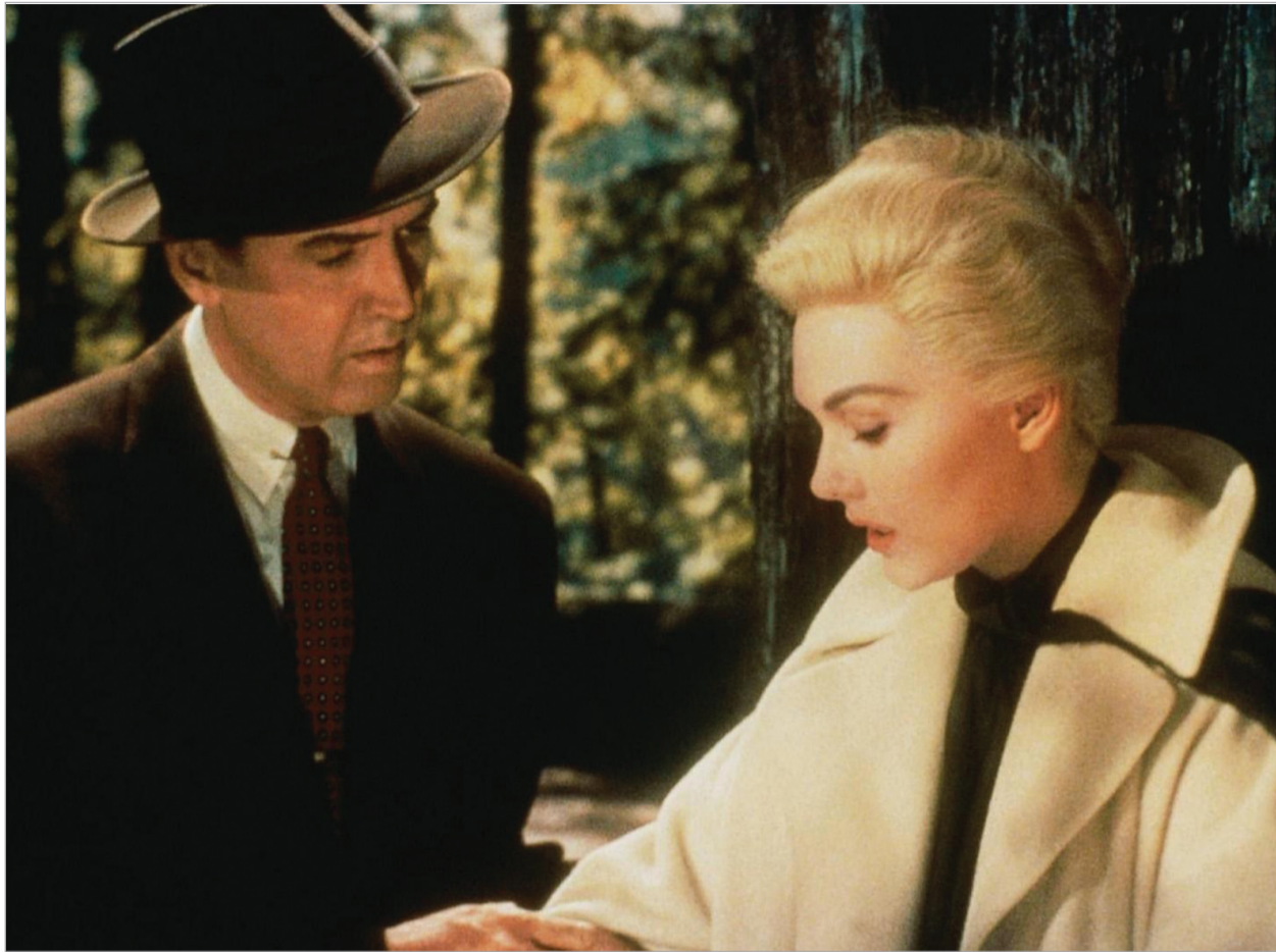
კარდი ფილმიდან "თავბრუსხვევა"

ზოგადად სია საკმაოდ მოძველებულად და ზედმეტად შავ-თეთრად გამოიყურება. მისთვის ცალი თვალის გადავლევაც საკმარისია, იმის მისახვედრად, რომ იმ 846 კრიტიკოსიდან ნახევარს ფერადი ფილმები არც უნახავს, სამგანზომილებიანის შესახებ კი ალბათ არც სმენია და არც უნდა გაიგოს. ცხადია, თანამედროვე ფილმების 80% სრულ აბდაუბდას წარმოადგენს და ჯობს, მათმა რეჟისორებმა სხვა საქმე გამოიჩინონ, მაგრამ უკანასკნელი 20 წლის განმავლობაში შექმნილი კინოსაგანძურის ასე ერთბაშად უარყოფა ნამდვილად არ შეიძლება. ამ გამოკითხვის ავტორებს ალბათ იმის შესახებ სჭირდებათ, რომ 1952 წლის შემდეგ მთელი 60 წელია გასული და თუ მაშინ ყველა დროის ფილმები 50 ერთეულიან სიაში ეტეოდა, დღეს ეს შეუძლებელია და ჯობს სიის მოცულობა გაზარდონ.