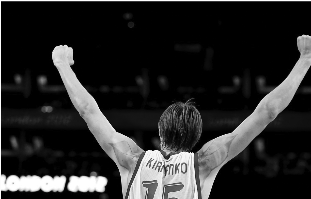
ლიტვასთან ანდრეი კირილენკომ 19 ქულა და 13 მოხსნა აკრიფა