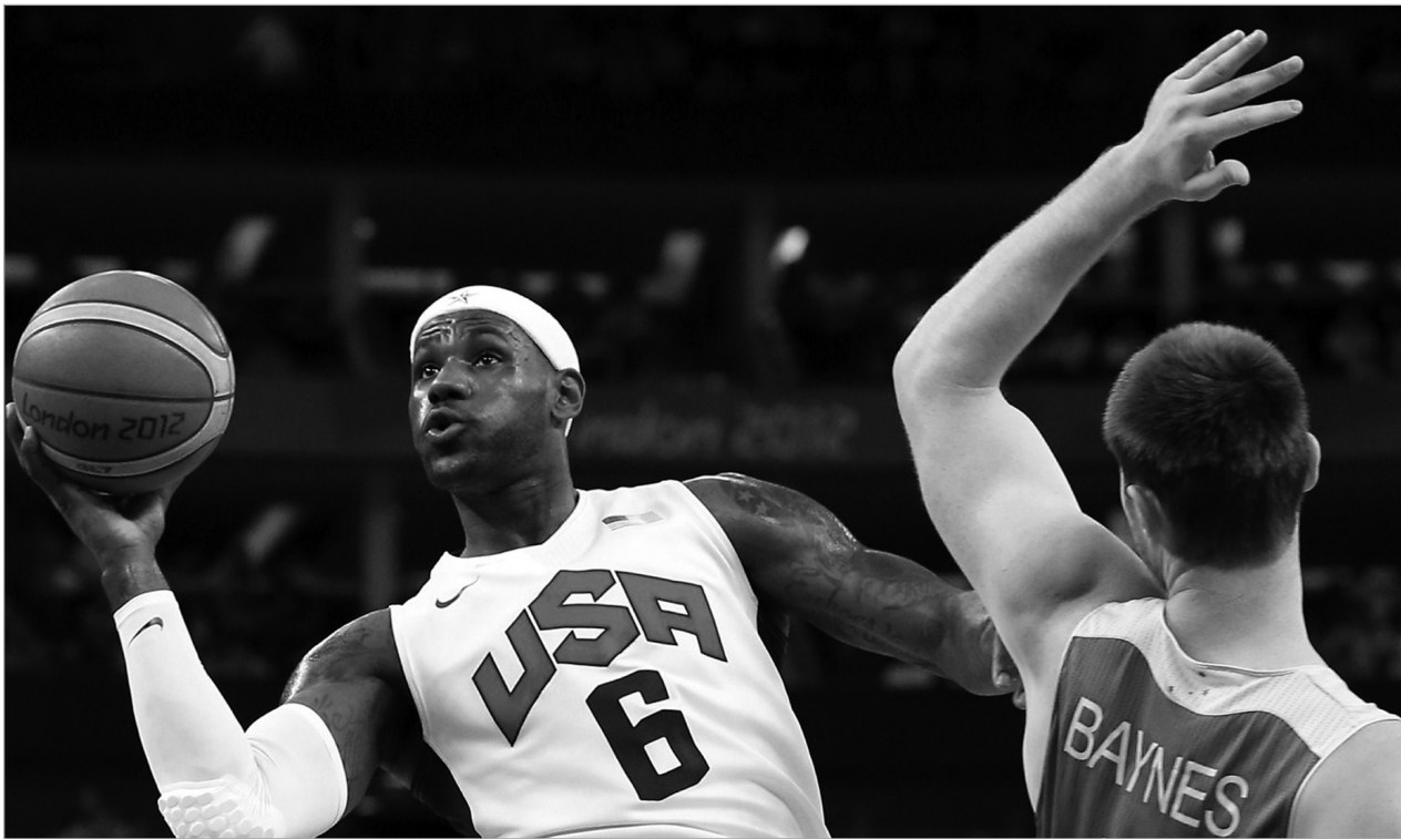
ლებრონ ჯეიმსმა სამმაგი დუბლი აიღო