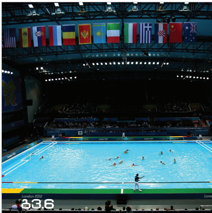
წყალბურთელებს საინტერესო ტურნირი აქვთ