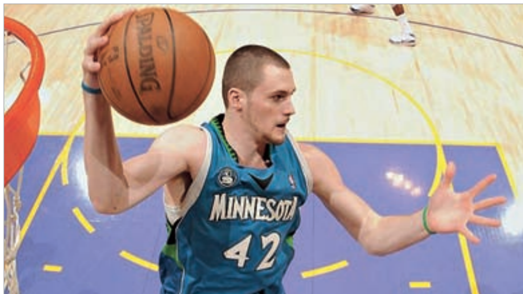
მინესოტას ლიდერი კევინ ლავი