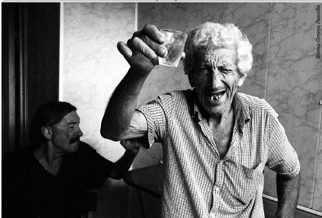
Фото Отто Лакоба