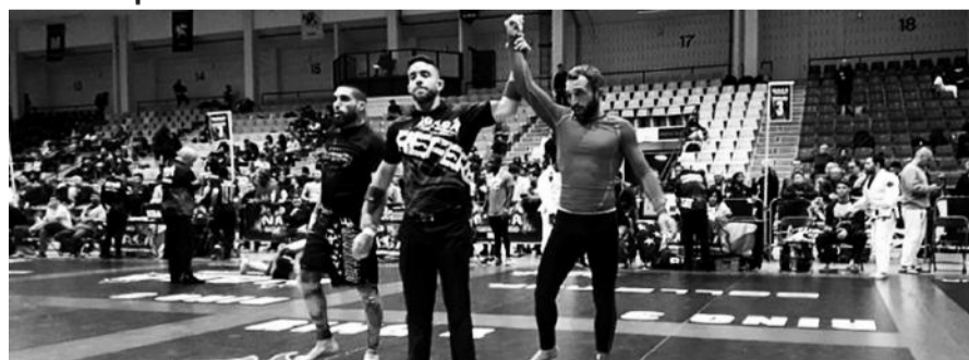
Соревнования проходили в Соединенных Штатах Америки.

«Армяне Абхазии получили самую дружескую теплую поддержку от абхазского народа, которому тоже было нелегко в те времена. Мы выстояли, пережив трагедию, которая была на этой земле, - весь многонациональный народ Абхазии. Я хотел бы, чтобы все знали: в единстве наша сила. Вместе мы сможем преодолеть все. Наша задача - передать все, что в нас вкладывали наши старшие, подрастающим поколениям», - сказал глава государства.