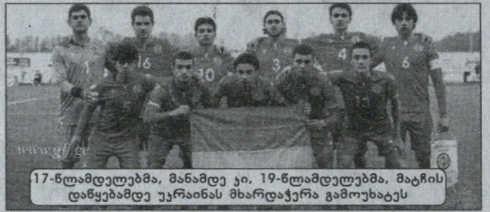
17-წლამდელთა, მანამდე კი, 19-წლამდელთა, მატჩის დაწყებამდე უკრაინის მხარდაჭერა გამოუხატეს