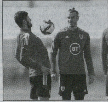
უმთავრდება. მიმდინარე სეზონში მან ლა ლიგაში მხოლოდ 4 შეხვედრა ჩაატარა და 1 გოლი გაიტანა.

ლის შესახებ სიმართლეს მალავს და ფეხბურთელს ხელს აფარებს: – ყველამ ვიცოდით, რომ მას ზურგი სტკიოდა, ის კი, „სანტიაგო ბერნაბეუზე“ არც კი მივიდა, რომ თანაგუნდელებისთვის მზარდაჭერა გამოეხატა. ანელოტი და „რეალი“ მას ხელს აფარებენ, მაგრამ ამის გაკეთება საჭირო არ არის. ვფიქრობ, ყველაფერი უნდა ითქვას და გავიგოთ, რაშია საქმე. არადა, იყო დრო, როდესაც გვეჩვენებოდა, რომ კრიშტიანო რონალდუს წასვლა არც ისე სერიოზულად აისახებოდა „რეალზე“, რადგან გუნდში ბეილი რჩებოდა, – ამბობს რომერი. 32 წლის ბეილს „რეალთან“ მოქმედი კონტრაქტი მიმდინარე სეზონის ბოლოს