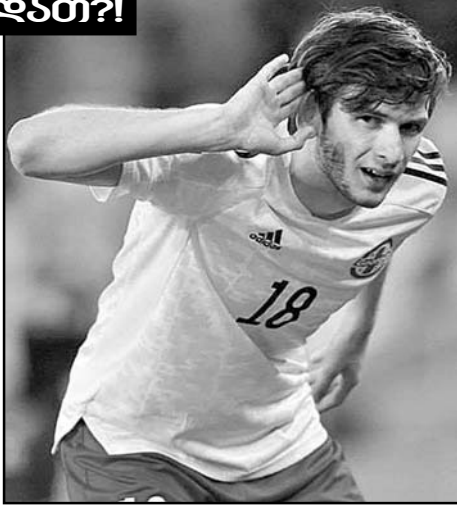
სად გასწავლეს და ავადიყვანეს ამდენი სიმტყრე და სიბინძურე? ბრყევებს და ნაძირლებს მქუხარე ტაში, კუსკური!

მარცხენო ვიში? სად დაიბადეთ, ვინ გაგზარდათ ასეთი ბრყევები!