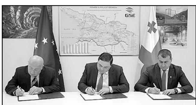
მოსაძიებლად, რომლებიც დაინტერესებული იქნებიან საქართველოს ტერიტორიაზე ქარის ელექტროსადგურების შემადგენელი კომპონენტების წარმოების დაფინანსებით და განვითარებით ან/და მათი შესყიდვით.

ემონომიკის და მდგრადი განვითარების სამინისტროს, სახელმწიფო სამხედრო სამეცნიერო-ტექნიკურ ცენტრ „დელტა-სა“ და „საქართველოს ქარის ენერჯის ასოციაციას“ შორის ხელი მოეწერა ურთიერთანამშრომლობის მემორანდუმს, რომლის ფარგლებშიც მათ ვალდებულება აიღეს, კომპეტენციის ფარგლებში, ხელი შეუწყონ საქართველოში ქარის ელექტროსადგურების ინდუსტრიული წარმოების დაწესებას, რაც თავის მხრივ, გამოიწვევს ახალი სამუშაო ადგილების შექმნას, ქარის ელექტროსადგურების ენერგეტიკულ ინფრასტრუქტურაში ინტეგრირებას და ელექტროენერჯის წარმოებას. ინფორმაციას ეკონომიკის სამინისტრო ავრცელებს.