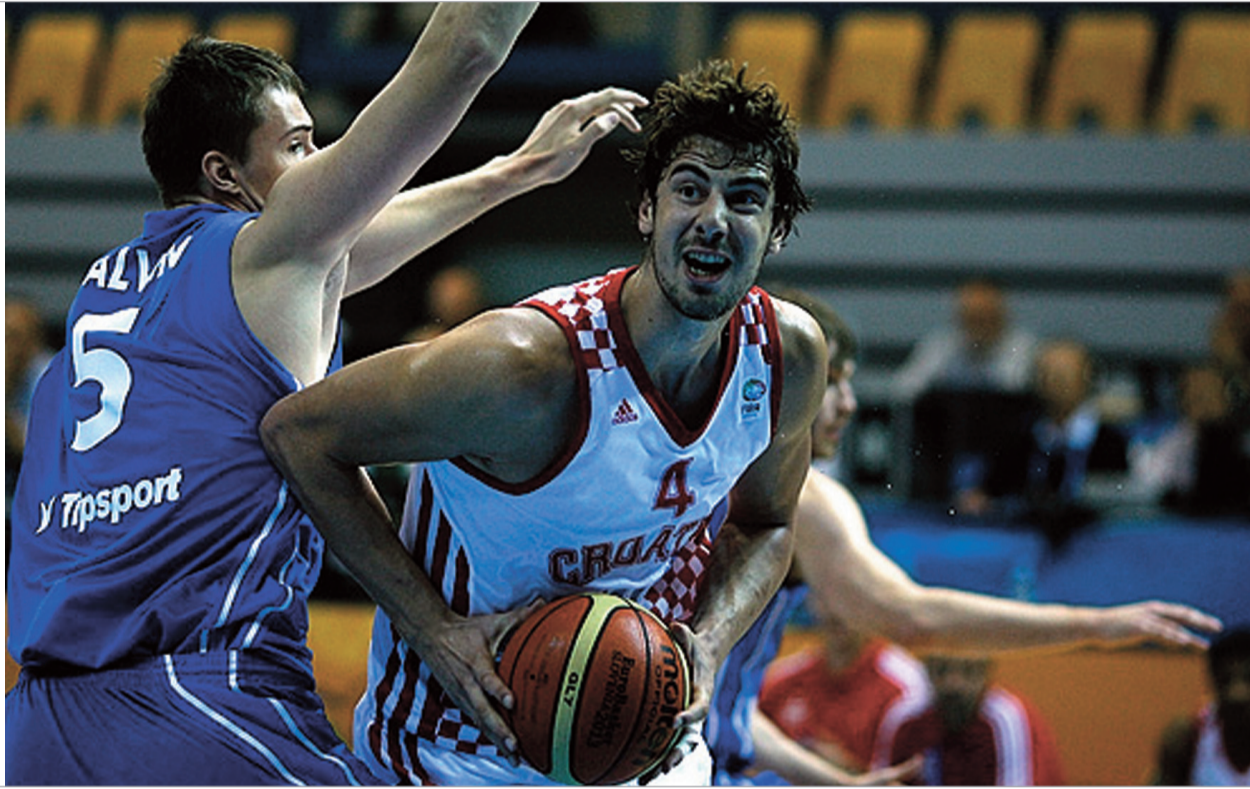
ხორვატიის ერთ-ერთი ლიდერი ანტე ტომიჩი

საქართველოს ნაკრებმა დახურა ევრობასკეტი და კოტე ტულუში ჯერ სლოვენიაშია. საქართველოს ნაკრების მთავარი მწვრთნელის, იგორ კოკოშკოვის ასისტენტი იქ მწვრთნელების სემინარებზეა. კოტესთან ერთად სემინარებზე ჩაიხილნენ ზვიად ბაბიაშვილი და ბუბა ბერიშვილი. ახალგაზრდა მწვრთნელებს ესაუბრებინა ჟან ტაბაკი, პაბლო ლასო და მწვრთნელების ვიტო კორლეონე, მისტერ ჟეიკო ობრადოვიჩი. მაგარი ბიძა და კოტეს და მის კოლეგებს გაუმართლა, რომ ამ სემინარებზე ობრადოვიჩის ლექციებს დაესწრებინა. კოტე ძალიან კარგი, ჩვენთვის განსაკუთრებით საინტერესო და ხშირი რესპონდენტი. ამომწურავი პასუხები და იღებ იმას, რაც გინდა, რომ მიიღო. ამჯერად ვისაუბრეთ საქართველოს ნაკრების მონინალმდეგეებზე და არა მხოლოდ იმ ხუთ ნაკრებზე.