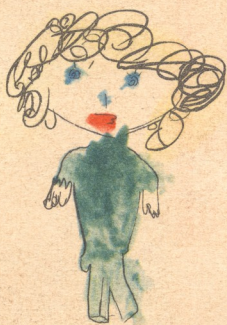
„ოგონა“ ნახატი ნინო არსენიშვილისა, 4 წ. თბილისი.