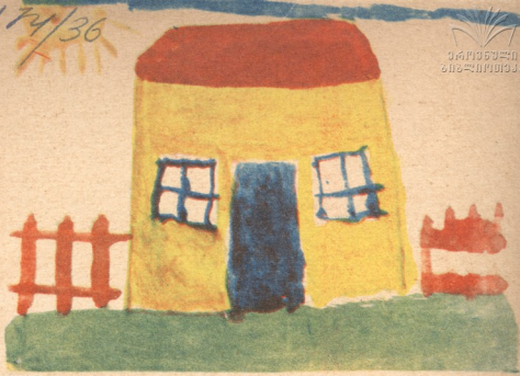
„ჩემი სახლი“ ნახატი შოთა უაზბეგისა, 6 წ. ყაზბეგი.