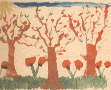
„აქვავებულნი ხეები“ ნახატი კახა ფიცხელაურისა, 6 წ. ყაზბეგი.