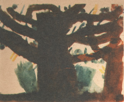
„ნახატი ელგუჯა მარსაგიშვილისა, 5 წ. ყაზბეგი.“