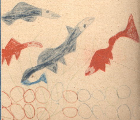
„თევზები“ ნახატი გიორგი ლალიძისა, 6 წ. თბილისი.