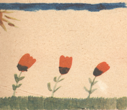
„უაუაჩოები“ ნახატი მარგხოფიკაშვილისა, 6 წ. ყაზბეგი.