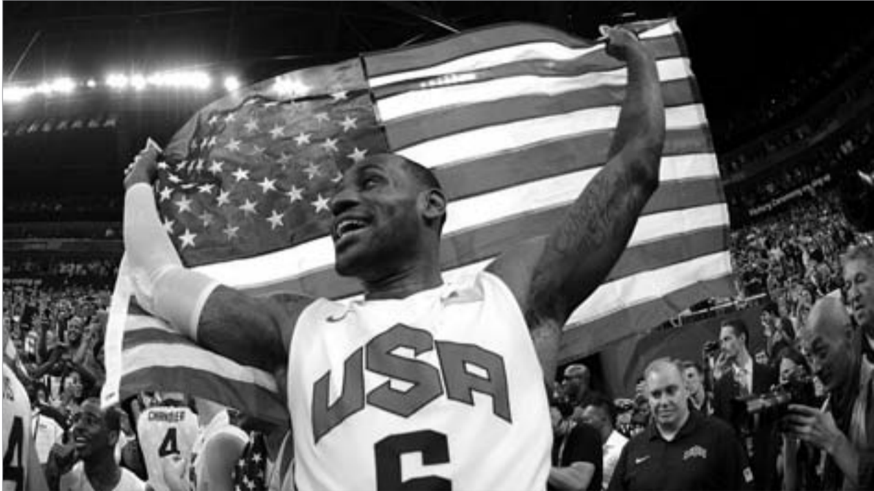
ოლიმპიური ჩემპიონი. მისტერ ლებრონ კეიმსი

ამერიკამ ფინალი 107:100 მოიგო. არ დაიძაბა, არ იბრუქა, არ იწუნუნა, არ ინერვიულა და საკუთარი ხალხი, ახლობლები სულ ოდნავ ანერვიულა. ამერიკამ მოიგო და ესპანეთი ფინალში ილუზიით, მირაჟზე და პო გასოლით თამაშობდა. ესპანეთმა ბოლოს 7 ქულა ვერ დაქაჩა. ამერიკამ ესპანეთს 7 ქულაზე მეტით არ მოუგო. კობი ბრაიანტის, ლებრონ ჯეიმსისა და კევინ დიურანის ნიჭი შვიდს წინ ორიანს მიუწერდა და ამერიკა +27-ით დახურავდა ფინალს. ბოლოს, როცა წვიმამ გადაიღო და ცისარტყელაზე ლებრონის ბიციფესები დავიხახუთ, ელექტროტაბლოზე მხოლოდ +7 ეწერა. ამერიკული +7.