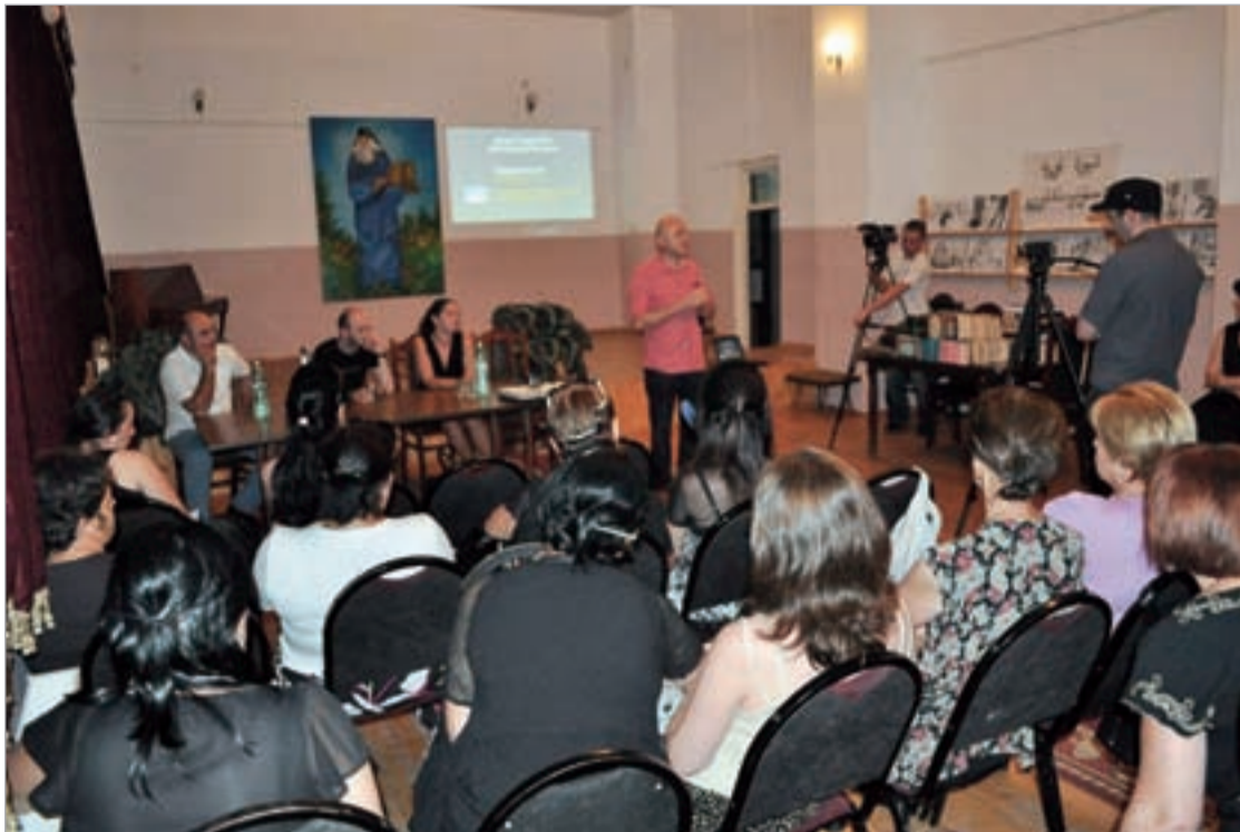
პრეზენტაცია ბოლნისის ბიბლიოთეკაში

ბოლნისში, ისევე როგორც სხვა რეგიონულ ბიბლიოთეკებში ბევრია ერთჯერადი გამოცემები, ადგილობრივი პერიოდიკა, ანდა ისეთი გამოცემები, რომელიც, გრიფის უქონლობის გამო, თბილისში არ ჩამოდიოდა, შესაბამისად, ეროვნული ბიბლიოთეკის საცავებში მას ვერ ვიპოვით. ერთიანი ეროვნული ბიბლიოგრაფიული ფონდის შესავსებად, ეროვნული ბიბლიოთეკის ადმინისტრაციამ, ეფექტურად მიიჩნია რეგიონების ბიბლიოთეკების პერსონალის დასაქმება, რომელიც საკუთარი ფონდების გაცეფრებაზე იმუშავებენ. აგვისტოს ბოლოს ეროვნული ბიბლიოთეკა მსგავს პრეზენტაციას სვანეთში, მესტიის რაიონულ ბიბლიოთეკაში მოაწყო და შეეცდებოდა მათ ჩართვას ელექტრონული განვითარების სინდრიკატი. პარალელურად კი, დაიწყო კონფერენციები საქართველოს სხვადასხვა რეგიონების ბიბლიოთეკებში, როგორც საბიბლიოთეკო სიახლეების