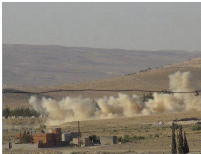
შეტაკება იორდანის საზღვართან

ფარული გარიგებები და დასავლეთის მოტყუების მცდელობა - ასეთია ამერიკული მედიის შეფასება ბაშარ ალ-ასადის რეჟიმის მოქმედებაზე მას შემდეგ, რაც გაირკვა, რომ სირიის ხელისუფლება, რუსული ბანკების მეშვეობით, დასავლური სანქციებისთვის გვერდის ფარულად ავლას აპირებდა. ამის შესახებ სტატია გავლენიან გამოცემა "უოლ სტრიტ ჯორნალში" დაიბეჭდა.