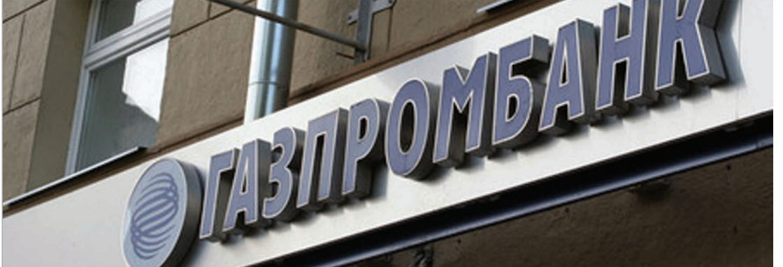
ასადთან თანამშრომლობაში "გაზპრომბანკს" ადანამაულებენ

თუმცა, რუსული მხარე ბრალდებას კატეგორიულად უარყოფს. "გაზპრომბანკი" და "ნოვიკომბანკი" არ ადასტურებენ, რომ მათი მუშევრებით ხდებოდა სირიული კომპანიების ოპერაციების წარმოება. "უოლ სტრიტ ჯორნალის" რედაქციას ხელში ჩაუვარდა დოკუმენტაცია და სირიის ხელისუფლების რუსულ კომპანიებთან მიმოსწრა, სადაც იორდანიაში გაქცეული სირიის ყოფილი პრემიერ-მინისტრის რიად ჰვიჯების სახელიც ფიგურირებს. საიდუმლო კორესპონდენცია დათარიღებულია მიმდინარე წლის მარტიდან ივლისამდე პერიოდით. ცალმხრივი სანქციები ამერიკის შეერთებულმა შტატებმა და ევროპამ ასადის რეჟიმს გასული წლის აგვისტოდან დაუწყეს, რომლის უმთავრესი სამიზნე სირიის ეკონომიკის საფინანსო და სანავთობო სექტორია. სწორედ, ამ ღონისძიებების გამო დაკარგა ოფიციალურმა დამასკომ მომხმარებლები ევროპაში, კონკრეტულად კი, იტალიის, გერმანიისა და ესპანეთის სახით. 2012 წელს კი სანქციები კიდევ უფრო გამკაცრდა, გაფართოვდა იმ პირებისა და კომპანიების სია, რომლებიც აკრძალვებს უნდა დაექვემდებარებოდნენ. თუმცა, ერთიგა, ხისტი ღონისძიებები არ ეხებოდა არც რუსულ და არც სხვა კომპანიებს, რომლებიც ევროპისა და ამერიკის შეერთებულ შტატების ბაზარზე არ მუშაობდნენ. 2012 წელს სირიის სახელმწიფო ნავთობმომწოდებელმა კომპანია "სიტროლმა" 11 ხელშეკრულება გააფორმა ნავთობის გაყიდვაზე და ანგოლის სახელმწიფო