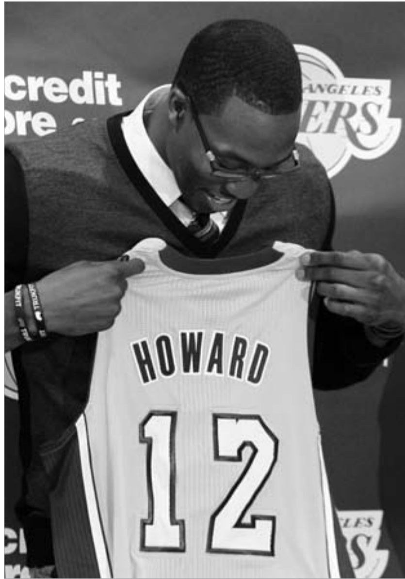
დუაიტ ჰოვარდი სერიოზული ტიპია

მელოუნი "ლეიკერსში" მისვლამდე, წინა სეზონში (2003), "იუტასთან" ერთად 20.6 ქულას, 7.8 მოხსნას, 4.7 პასს და 36.2 წუთს იღებდა. "ლეიკერსში" კარლი მესამე ოფიცია იყო და შემცირებულ დროში ფორვარდმა 13.2 ქულა, 8.7 მოხსნა და 3.9 პასი დაირტყა. მელოუნმა სტატისტიკა გადაკეცა და ჩემპიონობაზე გადაერთო. არ გამოვიდა. "ლეიკერსი" გაიშიფრა და კარლი ტრავმით თამაშობდა. რეგ-