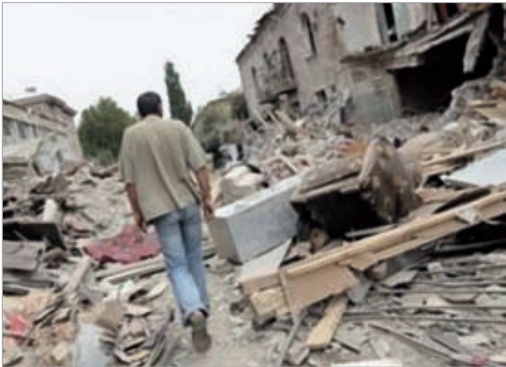
ასე გამოიყურება დღეს სოფელი კეხვი.

სამხრეთ ოსეთის მარინეტმა პრეზიდენტმა ლეონიდ თიბილოვმა ცხინვალის ჩრდილოეთით განლაგებული ქართული სოფლების დანგრევის ბრძანება გასცა. საუბარია 2008 წლის აგვისტოს ომის დროს განსაკუთრებით დაზარალებულ სოფლებზე, კერძოდ კი 8 დასახლებულ პუნქტზე - მათ შორის არის თამარაშენი, აჩაბეთი, ქურთა და კეხვი.