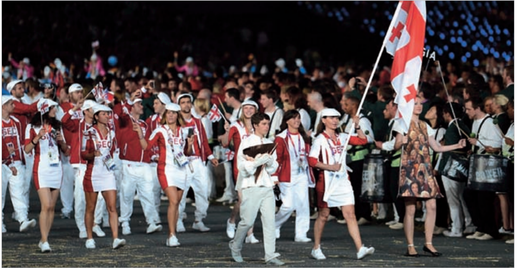
გია ნაცვლიშვილმა ლონდონში ქართველ ოლიმპიელთა შედეგები უპრეცედენტოდ შეაფასა

გია ნაცვლიშვილმა ძიუდოს ეროვნული ფედერაციაში შესაძლო საკადრო ცვლილებებზეც ისაუბრა. სეოკ-ის პრეზიდენტის თქმით, ძიუ-