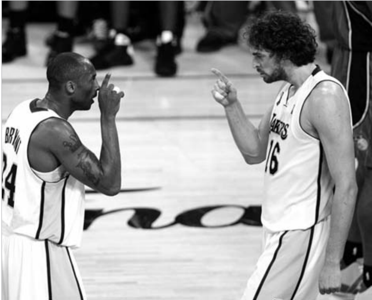
კობი ბრაიანტი და პო გასოლი

ის "ლეიკერსი" ზედიზედ სამჯერ იგებს სუპერფინალს (2000-02) და მერე გუნდი ტიმ დანკანის "სან ანტონიომ" 4:2 გააჩერა. 2003, დასავლეთის გარჩევები, დანკანი და დევიდ რობინსონი კობის ცრემლებით მტვირნიან ტექსასს ამშვიდებენ და "სან ანტონიომ" იმ სეზონში ყველა დარიგება მოიგო. "ლეიკერსი" უნდა შეიცვალოს. და ბოსებმა მელოუნს, ცოტა ხანში პეიტონსაც დაუძახეს. ფოქსი არ გამოვიდა. "ლეიკერსმა" გაშიფრა "სპურსი" 4:2 და ბოლო სერია "დეტროიტთან" 1:4 დატოვა. მელოუნმა კარიერა დახურა და პეიტონი შაკთან ერთად გადავიდა "მაიამიში", სადაც ჩემპიონი გახდა (2006, "დალასთან" 4:2). ჯექსონი წავიდა. დიდი მწვრთნელი ერთი სეზონით ისვენებს და "ლეიკერსში" რუდი ტომიანოვიჩს დაუძახეს. რუდიმ "პიუსტონში" ორი ფინალი