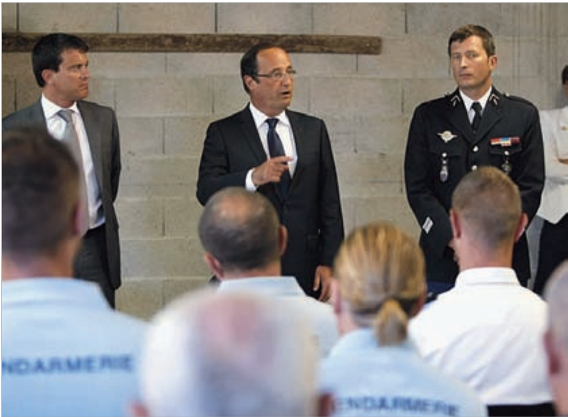
ფრანსუა ოლანდი ამიენის არეულობაზე საუბრისას

საგანაგებოდ ამენში ჩასულმა შინაგან საქმეთა მინისტრმა მანუელ ვალსმა განაცხადა, რომ დაუშვებელია იმათი გამართლება, ვინც დაწვა შენობები და პოლიციელებს ესროდა. მისი განცხადებით, ხელისუფლება ყველა საჭირო ზომას მიიღებს, რომ მსგავსი არეულობის განმეორება არ დაუშვას. ხალხი, ვინც მინისტრთან შესახვედრად მივიდა, მას სიტყვიერ შეურაცხყოფას აყენებდა, ზოგიერთებმა დამცავი დერეფნის გარ-