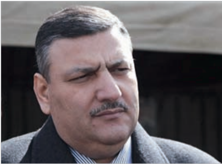
გაქცეული პრემიერი რიად ჰიჯაბი

სირიაში, სადაც რეჟიმის ძალადობა საკუთარი მოსახლეობის წინააღმდეგ უკვე 17 თვეა გრძელდება, ვითარების რეგულირება ამ დრომდე ვერ ხერხდება. ირანის მხრიდან ასადის რეჟიმის მხარდაჭერის შესახებ მორიგი განცხადება გაკეთდა ვაშინგტონშიც. შეიარაღებული ძალების გენშტაბის ხელმძღვანელის მარტინ დემპსის თქმით, თეირანი დამასკოს პარტიზანების მომზადებაში ეხმარება, რომლებიც შემდეგ პრეზიდენტ ასადის სახელით ამბოხებულებს ებრძვიან. შეერთებული შტატების თავდაცვის მინისტრმა კი რუსეთსა და ჩინეთს სირიის საკითხზე თანამშრომლობისკენ კიდევ ერთხელ მოუწოდა. ლეონ პანეტას თქმით, იმ შემთხვევაში, თუ რუსეთი და ჩინეთი სირიის კონფლიქტის მოგვარების ამერიკულ ვარიანტს მხარს არ დაუჭერენ, შეერთებული შტატები და მათი მხარდამჭერები სირიის ლიდერის რეჟიმისგან თავის დასაღწევად სხვა გზას მოძებნიან.