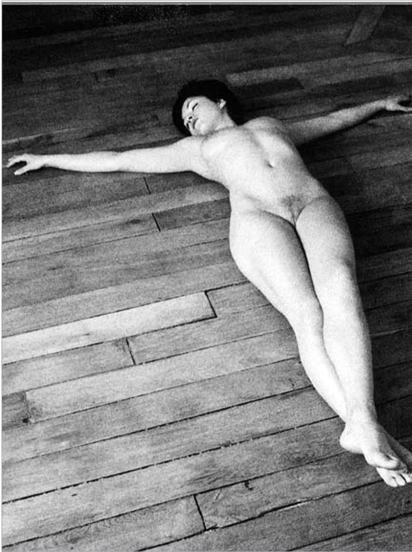
ან," - ამბობს ჟან-მარკ მილიე, თუმცა კი აქ არც სოციალური კონტექსტი იკითხება და არც - ესთეტიკური

"ჩავთვალე, რომ ეს ფოტოები საინტერესო იქნებოდა ქართველი დამთვალიერებლისათვის. ეს ფოტოგრაფია წარმოადგენს ერთგვარ ნაკრებს იმისა, როგორ ცხოვრობენ ჩვეულებრივი ადამიანები. ისინი პროფესიონალი მოდელები არ არი-