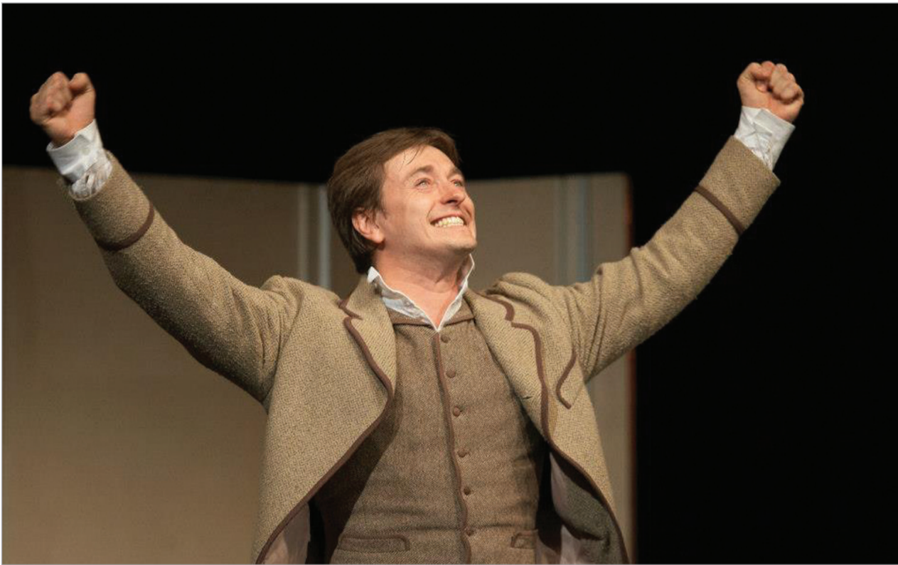
სცენები სპექტაკლიდან "ზოგჯერ ბრძენიც შეცდება"

მიტები და რეალობა ტაბაკოვის თეატრის შესახებ