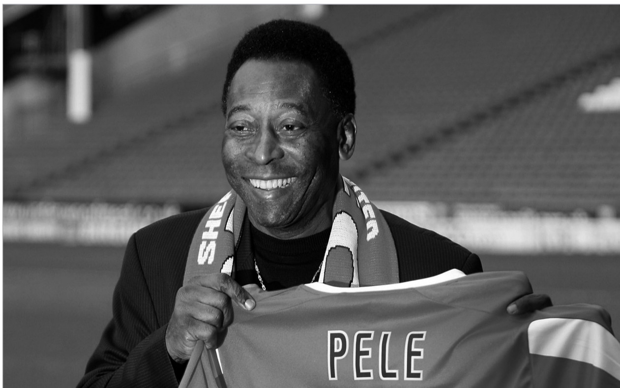
პელეს პროგნოზები ბერნისთვის ფატალური გამოდგა

ბელა გუტმანის წყევლა უკვე 50 წლისაა, თუმცა, ზუსტად არავინ