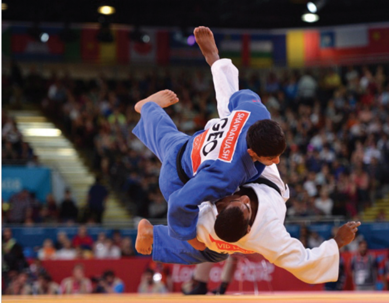
ძიუდოში არჩევანს წლის ბოლომდე გააკეთებენ