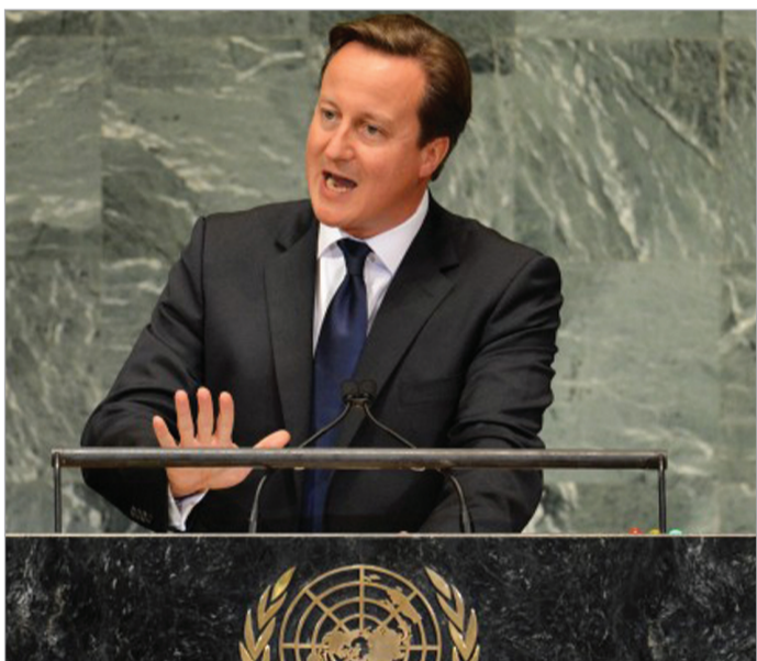
ბრიტანეთის პრემიერი დევიდ კამერონი