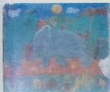
მანანა ძაბთარაძე. „სპილო“. 8 წ. 43-ე საშ. სკ.