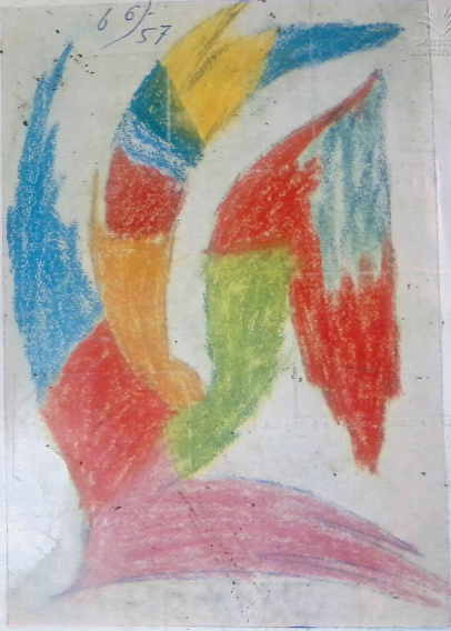
მამუკა ცაფარიძე. „ფერები“. 8 წ. 101-ე სკ. სკ.