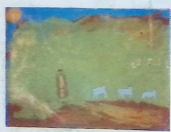
მამუკა მამარაშვილი. „ოღო შეცვარე“. 7 წ. 85-ე სკ. სკ.