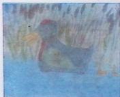
მანანა ძაბთარაძე. „იხვი“. 8 წ. 43-ე საშ. სკ.