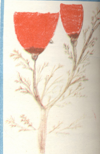
„ყაყაჩოტი“—ნახ. ლია გოდერძიშვილი, გიორგიშინდა.