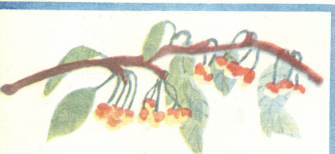
„ბალი“—ნახ. გელა გოდერძიშვილისა, გიორგიშინდა.