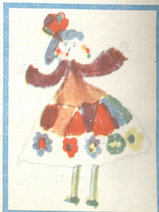
„ზურა“—ნახ. დავით კონჯაბაშვილისა, გიორგიშინდა. „ბოშა გოგონა“—ნახ. ხათუნა კუნჭულაძისი, 5 წ. თბილისი. „მდევი“—ნახ. — სლავა ბანძელაძისა, 5 წ. გულრიფში.