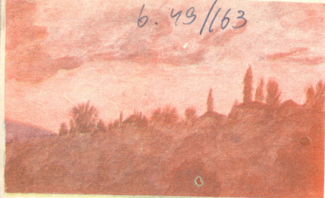
„ბეი შაჟი“—ნახ. ზურაბ ხოზაშვილისა, სოფ. გიორგიშინდა.