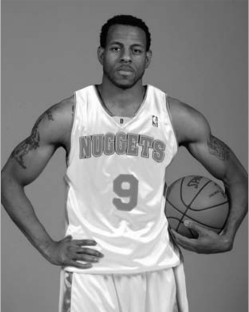
ანდრე იგუოდალა "დენვერში" გადავიდა