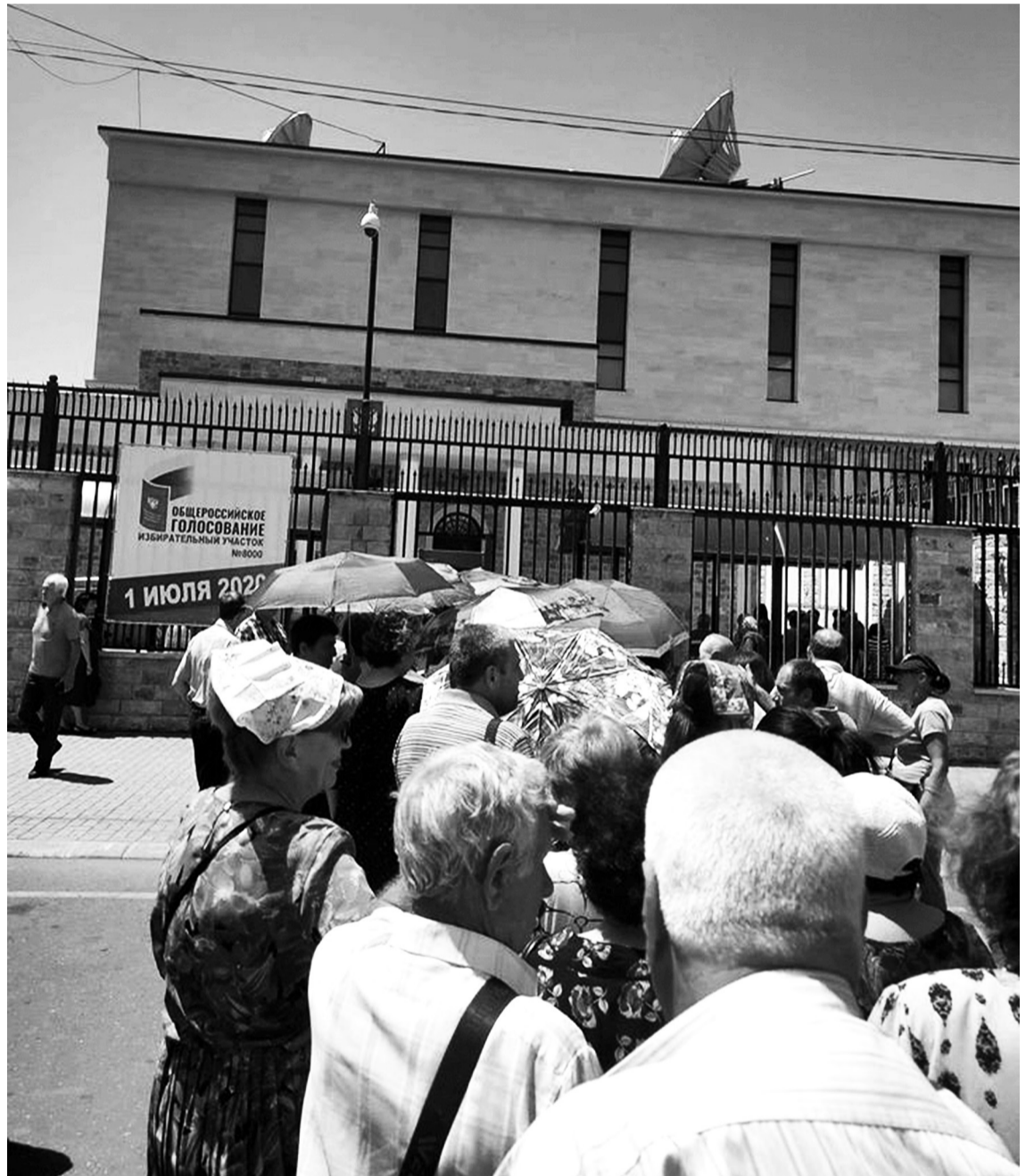
Пришлось отстоять очередь, но мы это сделали, проголосовали по поправкам в Конституцию РФ. Огромное спасибо тем, кто организовал транспорт из Пичунды до российского посольства в Сухуме.

«Наши медики, при всём огромном уважении к их стараниям, могут не справиться самостоятельно. Не потому что у нас мало специалистов по этой линии. Все медики занимаются сегодня этой проблемой, но их может просто не хватить, если разыграется пандемия, в полном понимании значения этого слова», – сказал глава правительства.