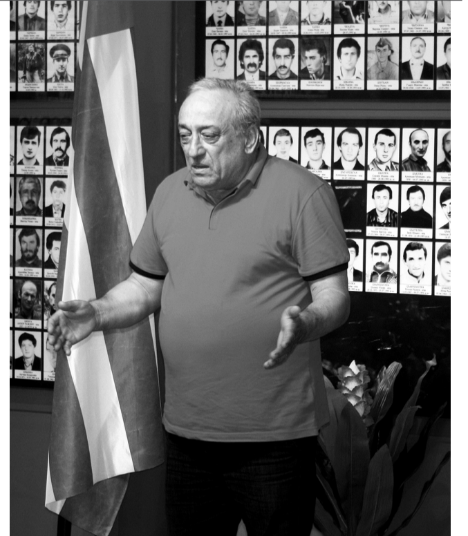
Ажәылараан илахәыз Леон иорден занашыоу Анзор Амаба

сазы, уахынла асаат аба рзы, Гәымстәтәи лбаатәи ацха икәсит 149-шык аибашыцәеи акомандирцәеи. Итәхеит 39-шык, ахәрақәа роуит 87-шык.