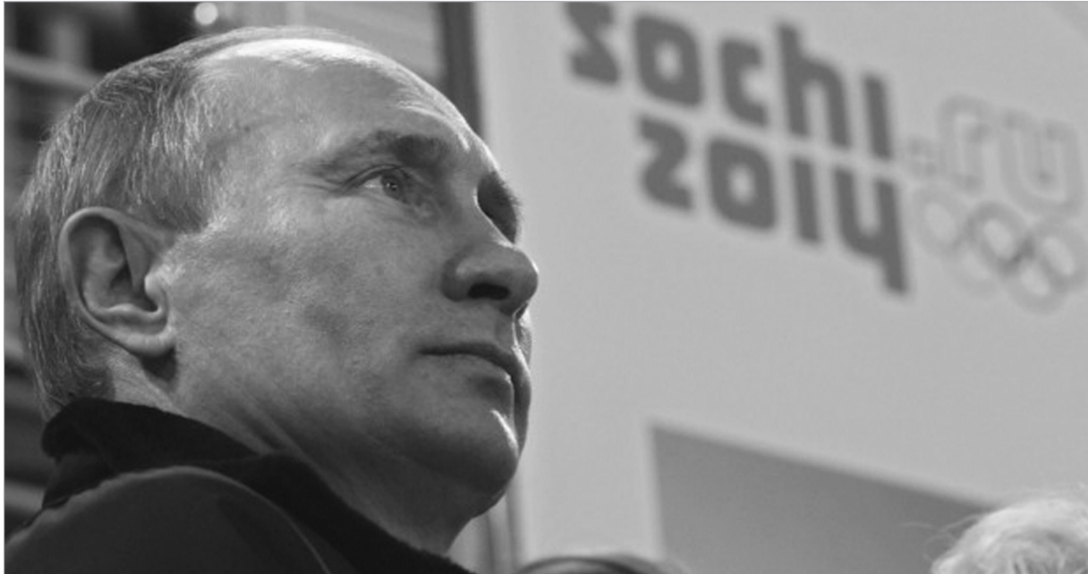
ქართველებს სამხარეთის ყოველთვის გვგონია, რომ პუტინი საქართველოსთან მიმართებაში დასაბრუნებელი უნდა იყოს

მაშინ, როდესაც ზამთრის XXII ოლიმპიურ თამაშებამდე ოთხ თვეზე ოდნავ მეტი რჩება, «სოჭი 2014»-ის საორგანიზაციო კომიტეტი, შესაძლოა, ახალ გაუგებრობაში აღმოჩნდეს. საქმე ეხება ოლიმპიადის სააკრედიტაციო ფორმაში აფხაზეთისა და სამხრეთ ოსეთის დამოუკიდებელ სუბიექტებად შეყვანას. განვმარტავთ, რომ საუბარია ევროპის მსოფლიო კავშირის მსოფლიო კავშირის ელექტრონულ ბაზაში განთავსებულ ტელე-მედის სა-