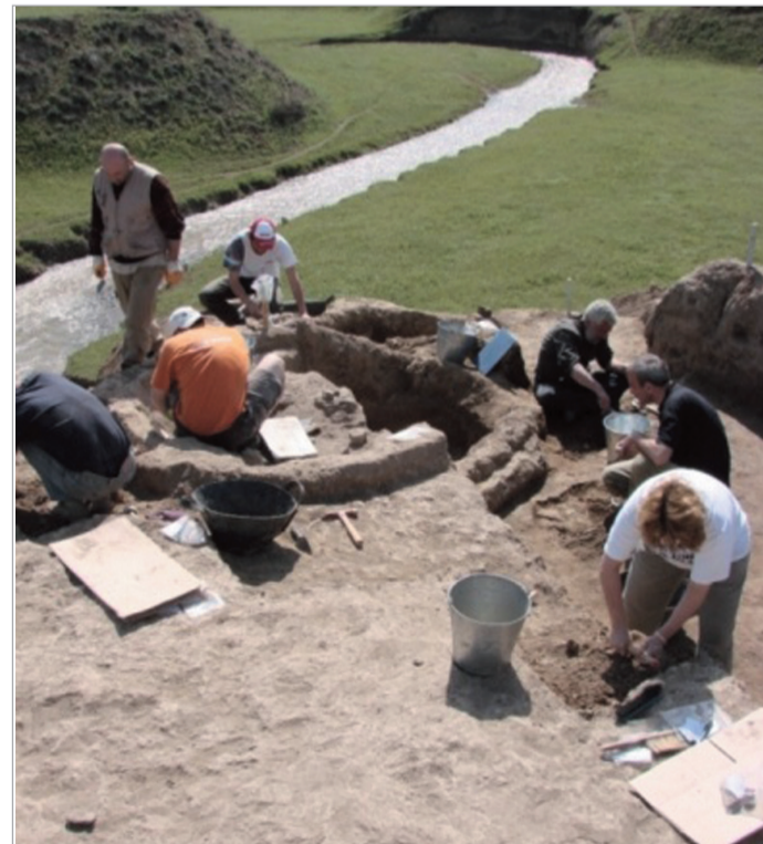
გაზრძაძე მ-5 გვირგვინი