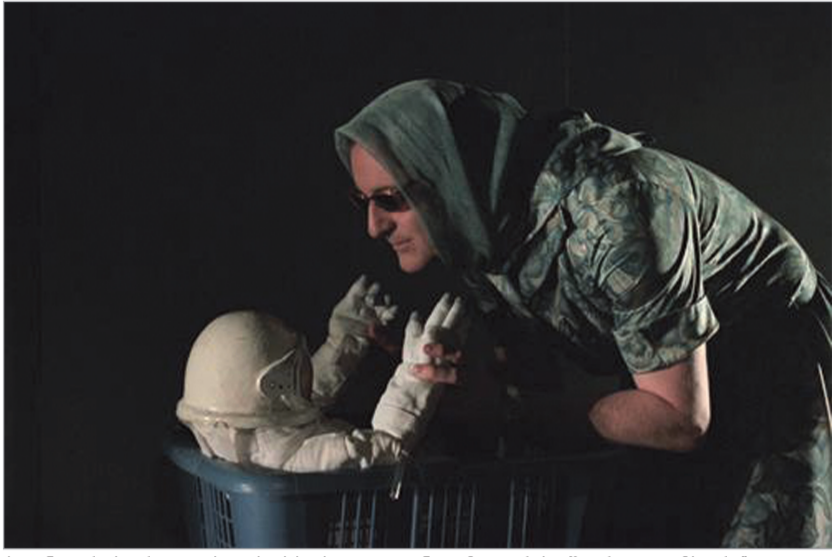
სვენა რობერტ ლეპაჟის სპექტაკლიდან მთვარის შორეული მხარე

კოსმოსური რბოლის დროს საბჭოელებისა და ამერიკელების გაუთავებელი კონკურენცია (დედამიწის გარეთ არსებული სივრცის)