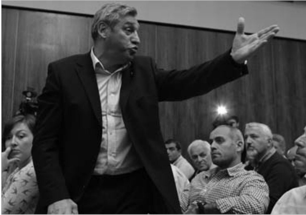
შოთა ხაბარელი ნაცვლიშვილს კონკურენტუნარიან არჩევნებში მონაწილეობას ურჩევს