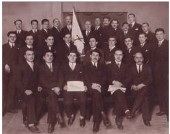
ქართული ემიგრაციის თეატრალური დასი