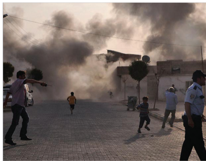
სირიიდან ნასროლი რაკეტით დაზარეული სახლი თურქეთში

თურქეთმა და ნატო-მ უპა- სუხოდ აღარ დატოვეს საზღვ- რისპირა ინციდენტი სირიას- თან, რომელსაც გუშინწინ თურქეთის მოქალაქეები შეე- წირნენ. გუშინ თურქეთის არ- ტილერიამ საპასუხო დარტყმა განახორციელა სირიის ტერი- ტორიაზე. ამ სახელმწიფოს მომავალში განსაკუთრებული სიფრთხილის გამოჩენა მოუ- წევს, წინააღმდეგ შემთხვევა- ში უკვე შეიძლება გაჩნდეს გა- რედან სამხედრო ჩარევის რე- ალური მიზეზი.