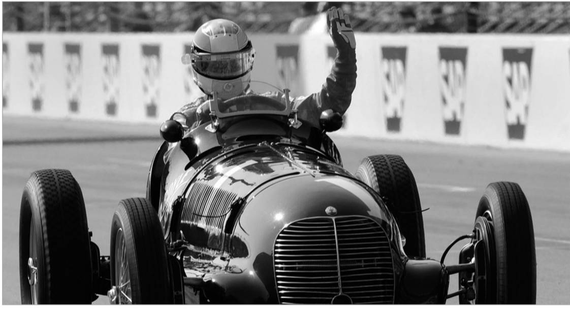
შუმახერს ინდიანაპოლისის ტრასაზე 1998 წლის "მაჯორაის" ბოლიდითაც შეუქცევია თავი

სამეფო რბოლათა მსოფლიოს შვიდგზის ჩემპიონი მიხაელ შუმახერი მიმდინარე სეზონის დასრულების შემდეგ კარიერას ფინიშამდე მიიყვანს. არადა ეს უკვე მეორედია, როდესაც "წითელი ბარონი" ტოვებს ფორმულა 1-ს.