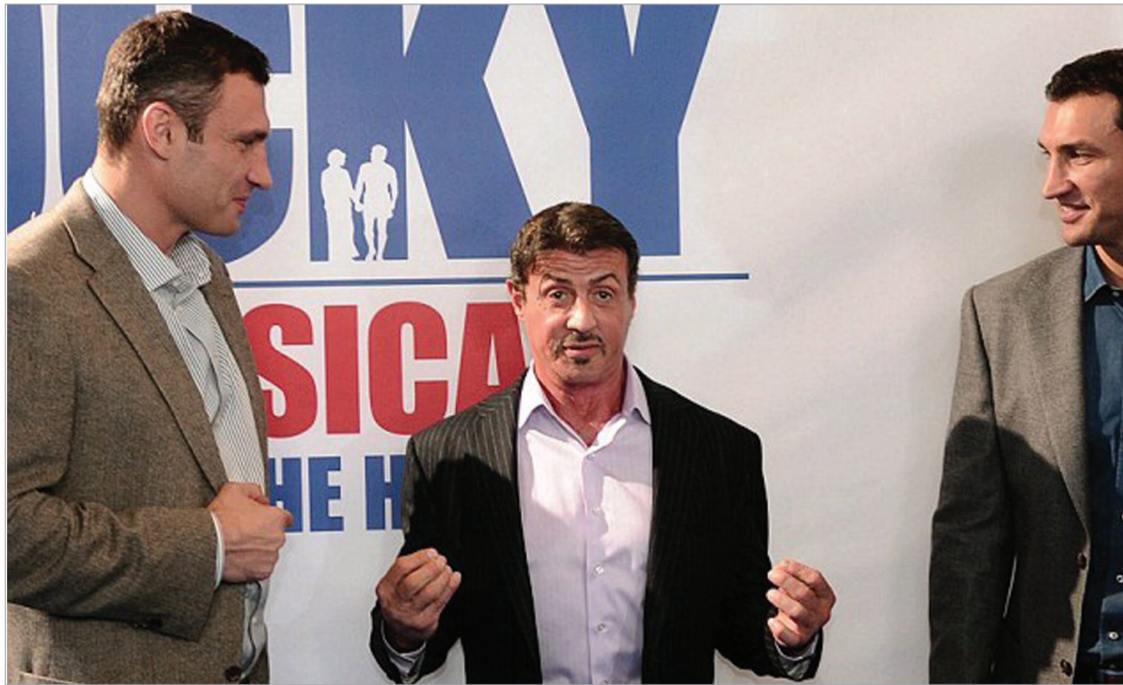
სილვესტერ სტალონე კლინიკებმა მოიმწყვდის

- ამერიკაში აღარ ჩანან კარგი მძიმეწონისნები. რატომ?