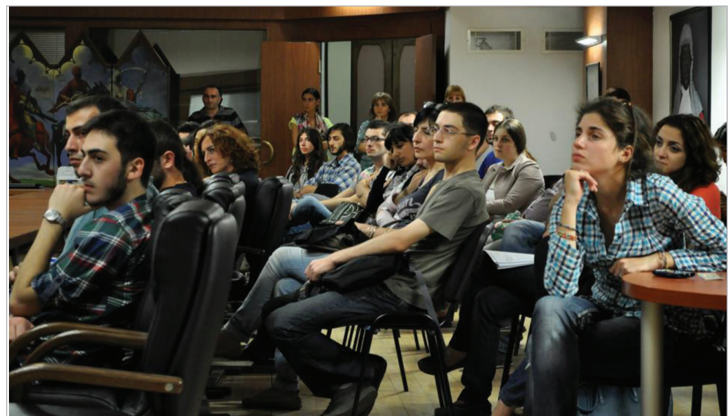
მსმენელი ეროვნულ ბიბლიოთეკაში