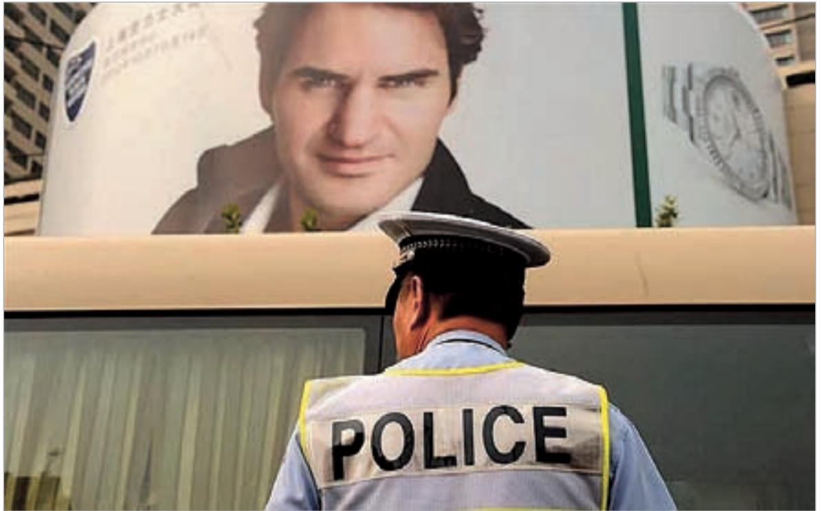
როჯერ ფედერერს მოკვლით ემუქრებიან.

ქვეყანაზე შეშლილების მეტი რაა, ჰოდა, ჩინეთის ხელისუფლებამ ასეთი მუქარა სერიოზულად აღიქვა. არც არის გასაკვირი, ქვეყანაში, სადაც ლამის მილიარდნახევარი ადამიანი ცხოვრობს, პროცენტულად მატულობს ალბათობა გამოიძებნოს ვინმე ტვინნაღრბობი. მაგალითად, ადამიანები მომავლიდან, რომლებმაც ის ფოტო განათავსეს ინტერნეტში.