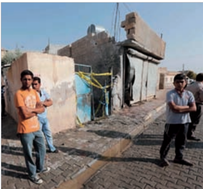
სირიიდან ნასროლი რაკეტით დაზარალებული სახლი თურქეთში

ხუთშაბათს გაერო-ს უშიშროების საბჭომ, რომელიც თურქეთის მოთხოვნით შეიკრიბა, სირიის მხრიდან თურქეთის დაბომბვის ფაქტი დაგმო. საბჭოს წევრებმა სირიის ხელისუფლების განმარტების, მეზობელი ქვეყნის სუვერენიტეტისა და ტერიტორიულ მთლიანობას პატივი სცეს.