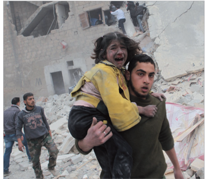
ბაზრძილაძე მე-4 გვერდი

სირიის ოპოზიციის სერიოზული განხეთქილებაა. კიდევ უფრო შემაშფოთებელია ის ფაქტი, რომ იქ რეალურად თითქმის აღარ დარჩნენ ზომიერი ფრთის წარმომადგენლები, უფრო მეტი ძალა და გავლენა ისლამისტების ხელში გადავიდა. ნიუ-იორკში, გაეროს გენერალური ასამბლეის ჩარჩოებში კი მიმდინარეობს ინტენსიური შეხვედრები უშიშროების საბჭოს მუდმივი წევრი სახელმწიფოების საგარეო საქმეთა მინისტრებს შორის, რომლებიც სირიის ქიმიური განიარაღების შესახებ რეზოლუციის ტექსტის შეთანხმებას ცდილობენ.