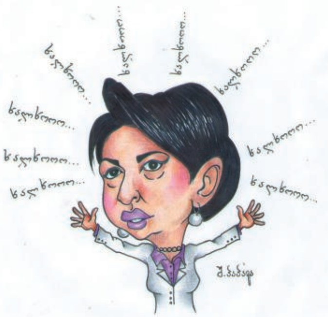
ახალ წელს ვილოცავთ...