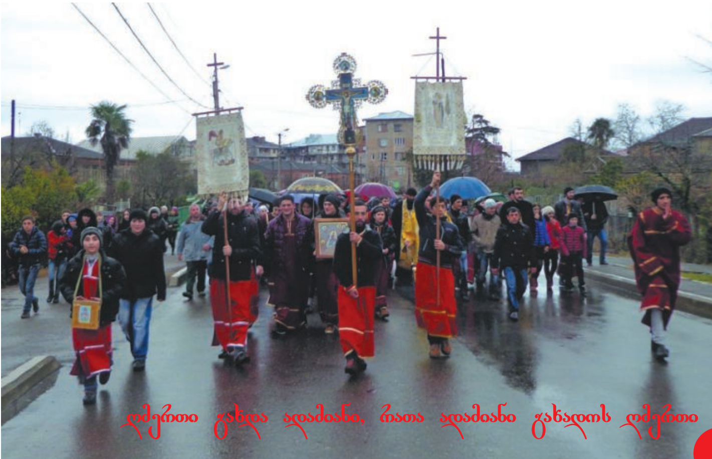
ღმერთი გზდა აღაძვანს, რათა აღაძვანს გზადღოს ღმერთი