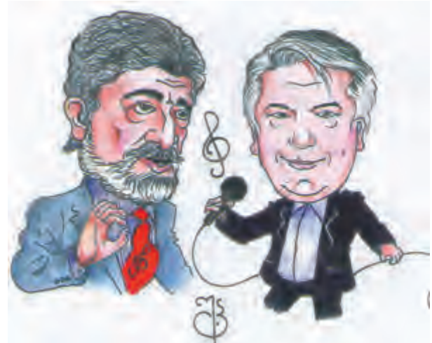
სამბრელია, სამბრელია, მუღა მუიანო...