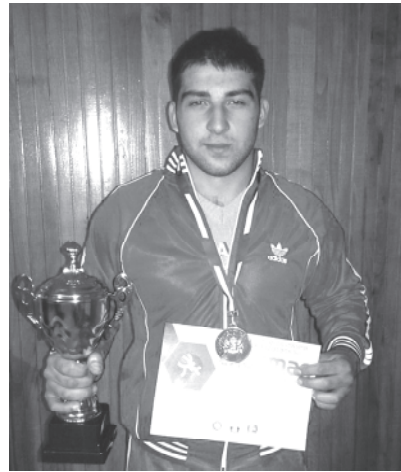
კილოგრამ წონით კატეგორიაში.

2014 წელს თბილისში საქართველოს სპორტის დამსახურებული მუშაკის ჯ. დავლიანიძის ხსოვნის პირველობაზე თავისუფალ სტილით 1999 წელს დაბადებულ მოსწავლეთა შორის 100 კილოგრამ წონით კატეგორიაში დაიკავა პირველი ადგილი. ამავე წელს ქ. ფოთის ღია პირველობაზე თავისუფალ სტილით პირველი ადგილი მოიპოვა, 69