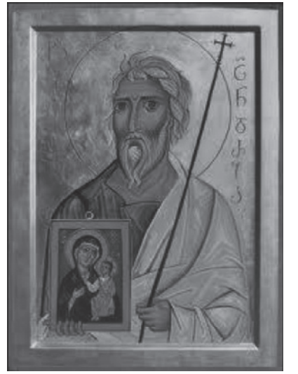
ყვედრე ღმერთსა ჩვენთვის, რათა სოფელსა მშვიდობა მოანიჭოს და სულთა ჩვენთა დიდი წყალობა”.

“წმინდაო მოციქულო, მოციქულთა უპირატეს წოდებულ ანდრია,