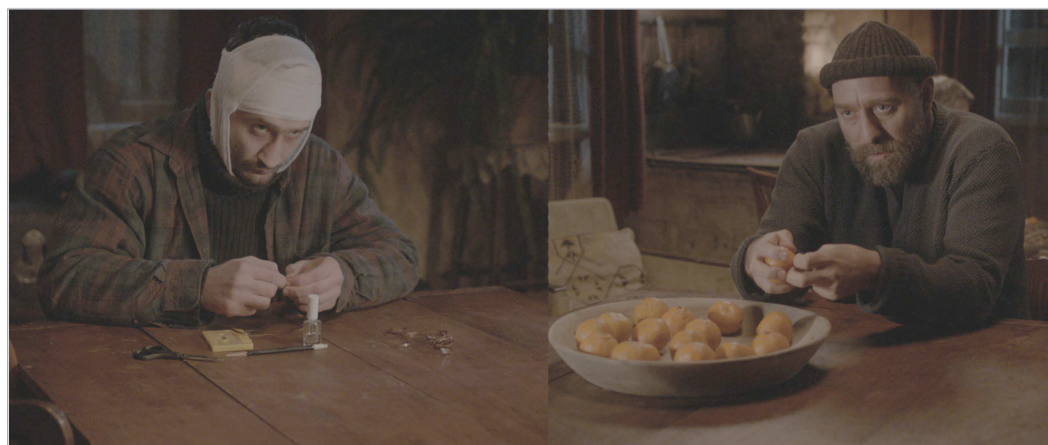
ბაზრქალაბა მ-5 გვარდუა

„24 საათის“ ელექტრონული ვერსია იხილეთ www.24saati.ge ჩვენი პარტნიორები: