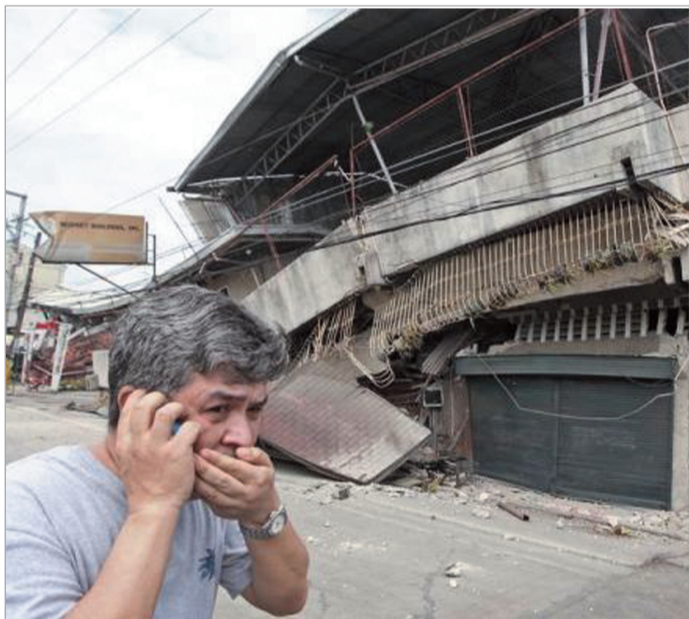
ბაზრქალაბა მ-6 გვარდუა

7,2 მაგნიტუდის მიწისძვრა მოხდა ფილიპინების არქიპელაგის ცენტრალურ კუნძულებზე. აშშ-ს გეოლოგიური სამსახურის მონაცემებით, ეპიცენტრი ტურისტებისთვის პოპულარულ კუნძულ ბოჰოლთან მდებარეობდა. მიწისძვრას, სულ ცოტა, 74 ადამიანი შეენირა - ძირითადად, ბოჰოლისა და სებუს პროვინციებში. მსხვერპლია ახლოს მდებარე სხვა კუნძულებზეც. ექიმების დახმარება ასობით დაშავებულს დასჭირდა. დაზიანდა და დაინგრა ათობით სახლი.