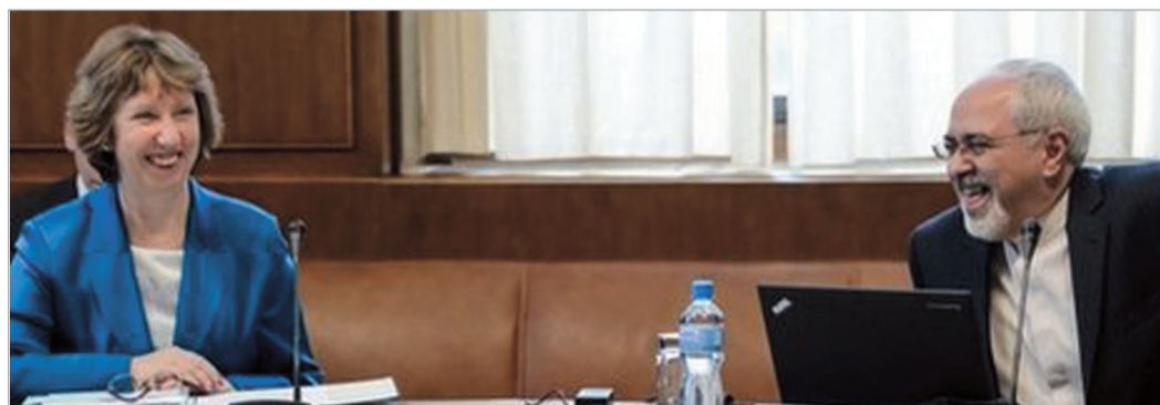
ბაზრქალაბა მ-6 გვარდუა

რებიან ევროკავშირისა და ატომური ენერჯის საერთაშორისო სააგენტოს წარმომადგენლები. მოლაპარაკებების ეს რაუნდი ორდღიანია და დღეს უნდა დამთავრდეს.