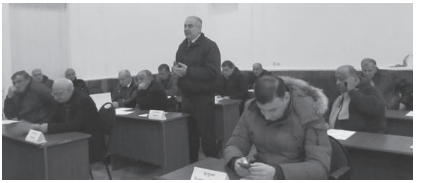
ბევრი უსიამოვნო მომენტი და მოსახლეობის სამართლიანი გაღიზიანება გამოიწვია. ამას დაემატა უშუქობა, რამდენიმე საათიანი კი არა, მაგალითად, დაბა კულაში ძაბვის გარეშე თითქმის 2 დღე იყო. ამან დისკომფორტი შეუქმნა არა მარტო მოსახლეობას, ერთ-ერთი ყველ-

აზე მსხვილი ინვენსტიციის მქონე სამკურნალო ფაბრიკა პარალიზებული აღმოჩნდა. ვფიქრობ, რომ გამგეობა ამ ნეგატიური გაკვეთილიდან მეტ ჭკუას ისწავლის და ზამთარს, რომელიც გრძელდება, შედარებით მობილიზებული შეხვდება”.