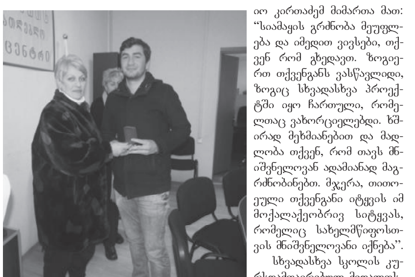
ციპალიტეტს 2014-2015 სასწავლო წლებში 45 მედალოსნით შეუძლია თავმოწონება. მეთორმეტე საჯარო სკოლის სამოქალაქო განათლების პედაგოგმა და გამგეობის საინფორმაციო ცენტრის დირექტორმა, სოფ-