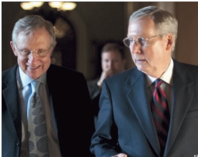
ჰარი რიდი და მიჩ რ მაკონელი

აშშ-ს სენატში დემოკრატებმა და რესპუბლიკელებმა შეთანხმებას მიაღწიეს, რომელიც მათ საშუალებას აძლევს, დეფოლტი თავიდან აიცილონ და სახელმწიფო დანესებულებების მუშაობა სრულფასოვნად განაახლონ. დემოკრატიული უმრავლესობის ლიდერმა სენატში ჰარი რიდმა განაცხადა, რომ ახალმიღწეული შეთანხმება გულისხმობს მთავრობის დაფინანსებას 2014 წლის 15 იანვრამდე და სახელმწიფო ვალის ზედა ზღვრის აწევას 7 თებერვლამდე.