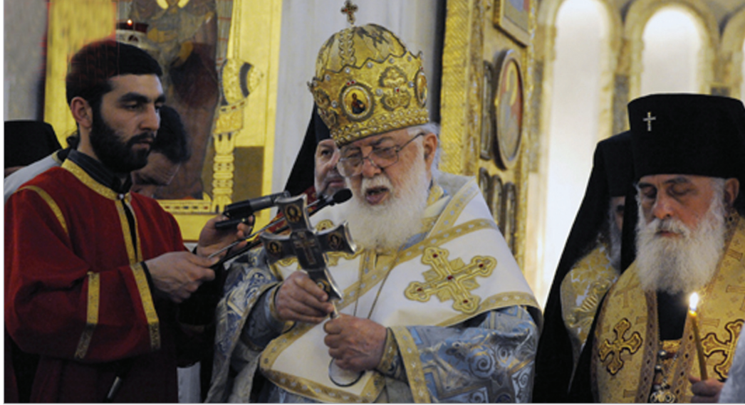
გაზრქობა მე-2 გვერდზე

გუშინ საქართველოში მცხეთობა - სვეტიცხოვლობა აღინიშნა. "კვართისა საუფლოსა და სვეტისა ღმრთივბრწყინვალისა და მირონმდინარისას" დღესასწაულთან დაკავშირებით, სრულიად საქართველოს კათოლიკოს-პატრიარქი ილია მეორე სვეტიცხოვლის საკათედრო ტაძარში საღვთო ლიტურგიას დილიდან ასრულებდა. სპეციალურად გუშინდელი დღისთვის მღვდელმსახურები, ბერმონაზვნები და მორწმუნეები სხვადასხვა კუთხიდან ჩამოვიდნენ.