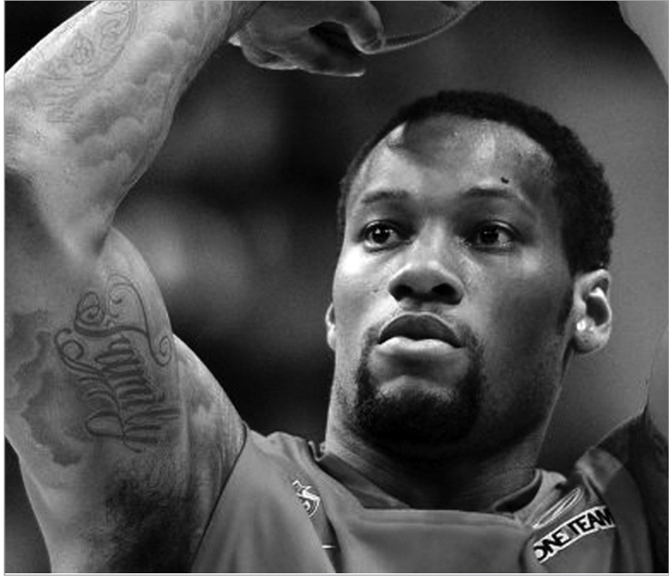
სონი უიმსმა "ლიეტუვოს რიტასთან" ბოლო ორ ნუთში აკრიფა

ძველი "ნიუ ჯერსი" ჯეისონ კიდის პრივატული პროექტი იყო. კიდი ხსნიდა, ჭრიდა, ქაოსს ღამაში ჯაზით ფარავდა და იმ ქაოსში კიდისგან რაღაცებს ზორან პლანინიჩი ითვისებდა. ხორვატი ფლეიმიქერი კალათბურთის ვივალდისგან ამერიკულად აზროვნებას, კორექტულ აგრესიას და თვალეზით კაცის მოტეხვას სწავლობს. ამერიკაში ზორანი სამი სეზონით რჩება და მერე ინყება მომთაბარე მილიონერის ევროკარიერა. ორი კარგი სეზონი ესპანეთში, ტაუსთან ერთად. ორი ისე რა სეზონი რუსეთში, ცსკასთან ერთად. ორი ნორმალური სეზონი იქვე, რუსეთში, "ხიმკისთან" ერთად და ამ ევროლიგას პლანინიჩი პატარა აკუსტიკური შედევრით ხსნის. მშვიდად, ისე რომ სხვები არ შეანუხოს, ხორვატი 31 ნუთში თითქმის ყველაფერს აგდებს თამაშიდან (10/7 2 pts, 1/1 3 pts) და თითქმის კიდი. "ხიმკი" რამდენიმე მონაკვეთი ვერ გაქაჩა, ზარმაცი ოროსანივით ირბინა და იმ მომენტში "ფენერბახჩემ" გადახია ზორანის გუნდი. შარშან პლანინიჩი ევროტასის პირველი კაცი იყო.