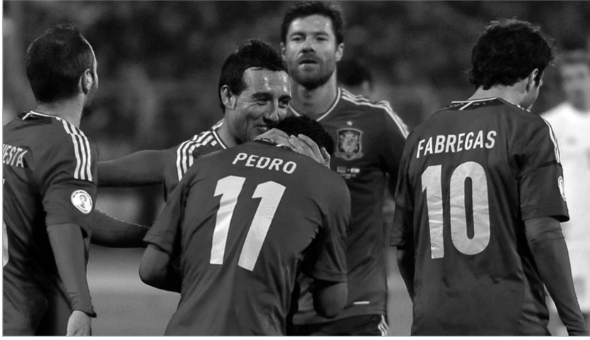
პედრომ ბელარუსთან საუკეთესო თამაში აჩვენა

ირლანდია-გერმანიის მატჩის დაწყებამდე ევროპულ მედიაში ბევრს საუბრობენ ბუნდეს-ნაკრებში არსებულ დაძაბულ ვითარებაზე. გიოტცე და კროსი მეტ სათამაშო დროს ითხოვენ, შვიდმთავარი ყველას დაუპირისპირდაო... მოკლედ, ბუნდესნაკრებში განხეთქილება მომწიფდა. თუ გერმანია-ირლანდიის მატჩის შედეგით ვიმსჯელებთ (6:1 გერმანიის ნაკრების სასარგებლოდ), უნდა ვივარაუდოთ, რომ იოჯახში ლიოპმა გუნდში არსებული ყველა კონფლიქტი მოაგვარა. გერმანიის ნაკრებმა, რომელმაც სეზონი არგენტინის ნაკრებთან ამხანაგურ მატჩში განცდილი მარცხითა და ავსტრიისა და ფარერების არადამაჯერებელი დამარცხებით დაიწყო, ჯოჯოანი ტრაპატონის გუნდი მინასთან გაასწორა. ირლანდიის ნაკრებმა ამ მატჩში მხოლოდ 32 წუთს გაძლო. ირლანდიელთა კარში პირველი გოლი 32-ე წუთზე ტონი კროსმა გაიტანა. ამის შემდეგ გადის კიდევ ნახევარი საათი (საუბარია სათამაშო დროზე) და გერმანიის ნაკრებს უკვე ხუთბურთიანი უპირატესობა აქვს. ალბათ ამ თამაშის შემდეგ ჯოჯოანი ტრაპატონი ირლანდიური და ბრიტანული მედიის კითხვას კიდევ კარგა ხანს ვერ გაუბედავს. ის, რომ ტრაპატონის ხელში ირლანდიის ნაკრები ერთ ადგილზე "შუქსაობს", ირლანდიური მედიისთვის ფაქტია, მაგრამ ასეთი მარცხის პატივზე უკვე დაუშვებელია. ტრაპატონის მიერ ირლანდიის ნაკრებში დახრეგლ მოსაწყენ და დაცვაზე ორიენტირე-