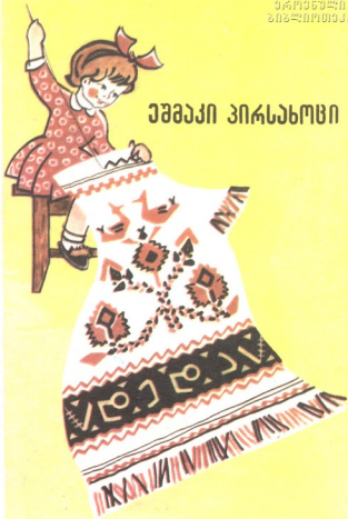
ტანიამ პირსახოცი მოქარგა. ვის უნდა არუქოს? ნახატს დააკვირი და თქვი!

აბა, ვინ არ იცოდა, რომ ყველაფერი იმ ქურდბაცაცა მელია კუდაგრძელის ოინები იყო.