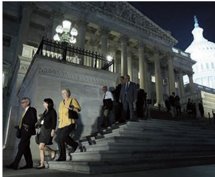
კონგრესმენებმა ღამე დატოვეს კაპიტოლიუმი