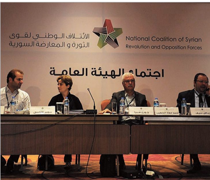
სირიის ეროვნული საბჭო

კონფერენციის გადატანა სირიის ვიცე-პრემიერმა კადრი ჯამილმაც გადასაჭურა. მან თქვა, რომ რუს დიპლომატებთან კონფერენციის ჩატარების დაახლო-