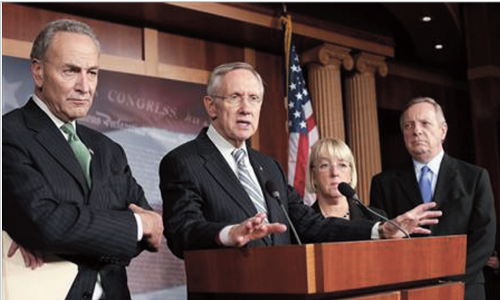
შარი რიდი დემოკრატ სენატორებთან ერთად

არსი ჩვენი მკითხველისთვის კარგად არის ცნობილი. თორემ ვალის ზედა ზღვარი 60-იანი წლების შემდეგ 70-ზე მეტჯერ გაიზარდა და ეს უმეტეს შემთხვევაში უმტკივნეულოდ და უხმაუროდ კეთდებოდა.