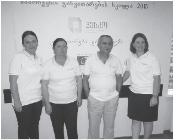
ული ხდება საარჩევნო პროცედურებთან და პროცესებთან მიმართებაში შარშ-

დამკვირვებლო ორგანიზაციებისთვის და მასმედიისთვის. ამდენად, მათი მეშვეობით ამომრჩეველი უფრო ინფორმირებ-