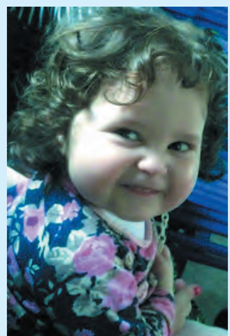
ფოტო განყოფილების მარიამ ბიბინაიშვილი