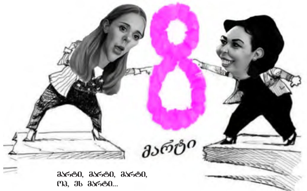
მარტი, მარტი, მარტი, ოკ, ეს მარტი...