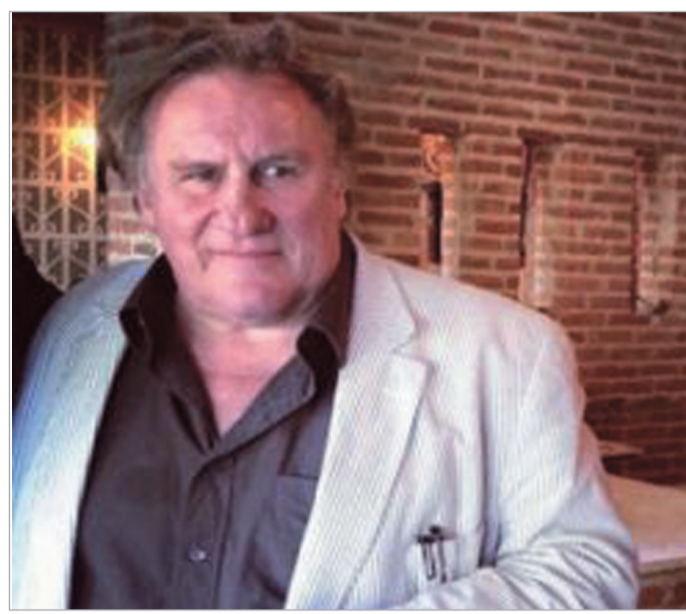
გაზრდილია მე-2 ბავარდია

გუშინ, ცნობილია ფრანგმა მსახიობმა ჟურნალ დეპარდიმ, რომელმაც რამდენიმე თვის წინ საფრანგეთის მოქალაქეობაზე მაღალი გადასახადების გამო უარი თქვა და დღესდღეობით კადროვთან მეგობრობით გაითქვა სახელი, საქართველოს საზღვარი გადმოლაზა. სხვა შემთხვევაში მას ალბათ ზარზე იმით შეხვედებოდნენ, თუმცა დღეს ის საქართველოს კანონის დამრღვევია.