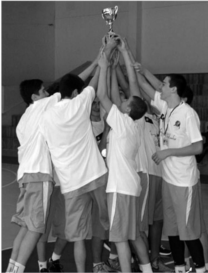
„აკადემია“, თბილისის 16-წლამდეელთა ჩემპიონატის ჭოკერი

თბილისის კალათბურთის განვითარების კავშირმა კიდევ ერთი საინტერესო ტურნირი ჩაატარა - თბილისის 16-წლამდეელთა ჩემპიონატი. თბილისში კალათბურთი უკვე კარგი ტონია. საქართველოს ნაკრები იგებს. საქართველოს ნაკრებს იცნობენ და ზაზა ფაჩულია ამერიკულ სუპერლიგაში ერთ-ერთი ელჩია. გემოვნებიანი, პოპულარული, კალათბურთის ელჩი. ელჩობაზე ბევრი გაიქაჩება. ელჩობა გადამდებია და გადამდები უნდა იყოს ისიც, რასაც თბილისის კალათბურთის განვითარების კავშირი აკეთებს. უბრალოდ, ატარებს ტურნირებს. უბრალოდ, ამ ტურნირების ჩატარებაში კავშირს საქართველოს კალათბურთის (ეროვნული) ფედერაცია ეხმარება. უბრალოდ, ეს კარგი და რეალურად საჭირო ივენთებია. და უბრალოდ, ამ ტურნირებზე ბევრი კარგი ბავშვი მოდის, მოდიოდა, მოვა. ტურნირის დღეები ბევრ კარგ მოგონებას ტოვებდა და ყველაზე თბილი მოგონება თვითონ ტურნირი იყო. გავიაროთ დეტალები.