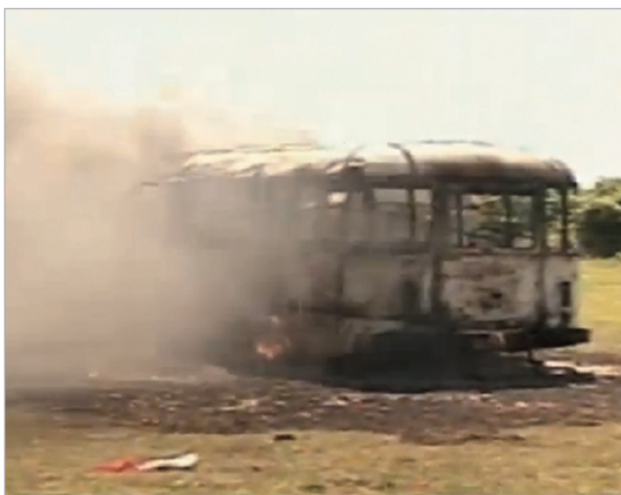
გაზრდილია მე-3 ბავარდია