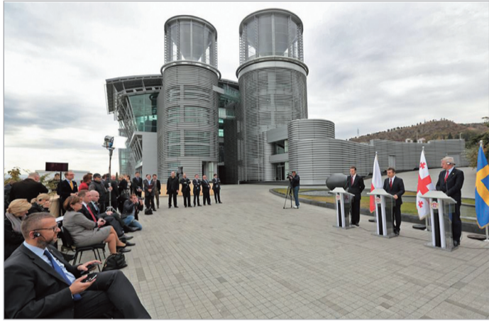
ნისტრებს საქართველოს პრემიერ-მინისტრმა ბიძინა ივანიშვილმა ბიზნეს-ცენტრში დილიდანვე უმასპინძლა.

პოლონეთისა და შვედეთის საგარეო საქმეთა მინისტრებმა რადოსლავ სიკორსკიმ და კარლ ბილდტმა საქართველოში მალაღირსი შეხვედრები გამართეს. სიკორსკი და ბილდტი საქართველოში «აღმოსავლეთ პარტნიორობის» რეგიონული ტურნეს ფარგლებში იმყოფებოდნენ. საქართველოში ჩამოსვლამდე ისინი უკრაინასა და მოლდავეთს ეწვივნენ. სწორედ პოლონეთისა და შვედეთის ინიციატივით ჩამოყალიბდა ევროკავშირის «აღმოსავლეთ პარტნიორობის» ინიციატივა. საგარეო საქმეთა მი-