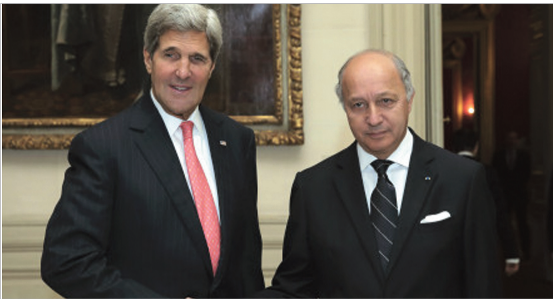
ჭონ კერი და ლორან ფაბიუსი

«მონდში» კვლავ დაიბეჭდა სტატია, რომელიც აშშ-ს ეროვნული უსაფრთხოების სააგენტოს მიერ ფრანგი დიპლომატების საუბრების მოსმენას ეხებოდა. ამაზე მინიშნება ზაფხულშიც იყო, თუმცა ამჟამად «ჯაბუშური ქექმა» უფრო დანერგულია არის ჩამოყალიბებული. გრინვალდის და სნოუდენის თანახმად, არსებობდა მაღალტექნოლოგიური