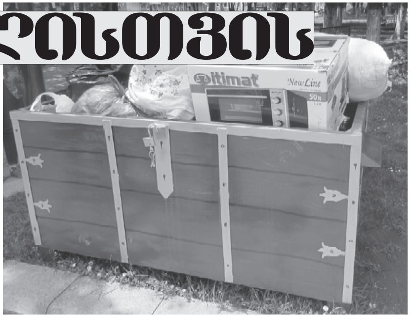
ტექნიკის შესაძენად გამოიყენეს და ავსებულ ზანდუკს შენაძენი ბოლო აკორდ-ად შეჰმატეს. მუნიციპალიტეტის გამგებელი ვალ-

მხარი. "ჩამოყვალბით მოხალისეთა ჯგუფი, რომელიც, იმედია, დღითიდღე გაიზარდება, მსურველები ბლომად გამოიწინდება იდეას, ყველამ მისი წვლილი შეიტანოს მათ დასახმარებლად, ვინც ამას საჭიროებს. ნებისმიერ მსურველს შეუძლია ამ ჯგუფის წევრი გახდეს. ეს იმას