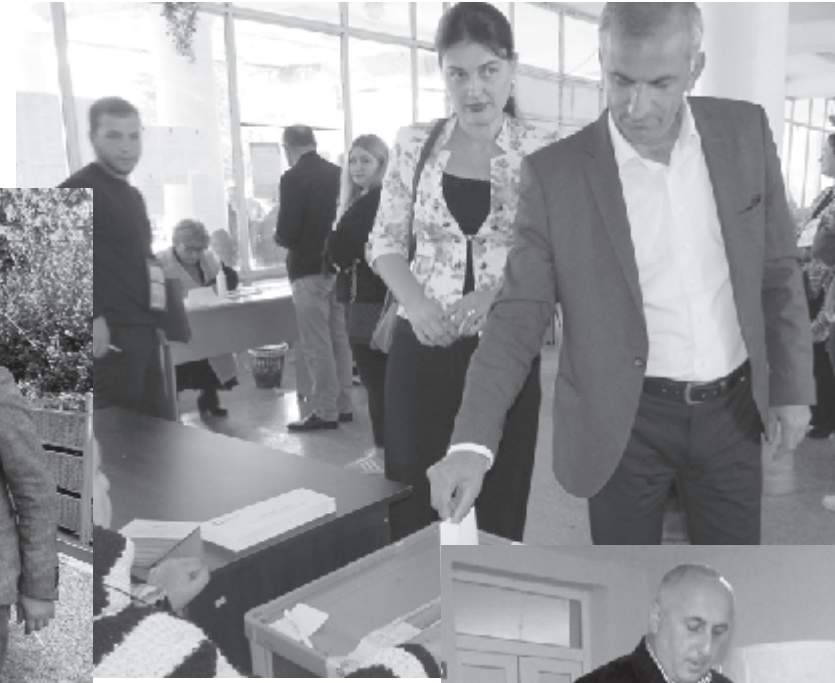
ურვა ერთმანეთს ორმა მოწინააღმდეგე პოლიტიკურმა ძალამ.

რვილი გახლდათ საარჩევნო ბიულეტენით საკუთარი პოზიციის გამოხატვისას. ზუნჯულაურის №16 უბანზე მან საკუთარი პოზიცია დააფიქსირა და იქიდან გამოსული მოწინ-