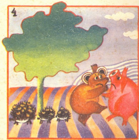
ხმატი სოფით კინწურაშვილისა