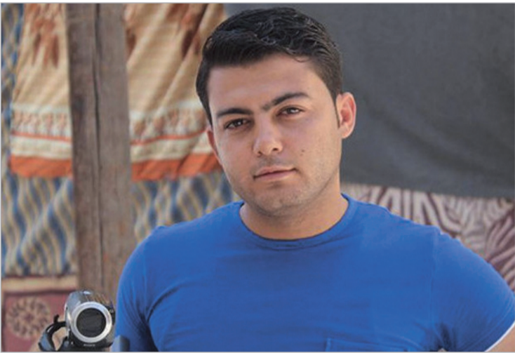
დაღუპული ჟურნალისტი მუჰამედ სიდი

მათ წინასწარ განაცხადეს, რომ ოპოზიციის მიერ კონტროლირებად რეგიონებში ამბოხებულებს მოსახლებასთან ან ირადიტი მიმართული მოუხლედათ. ხალხის მიერ მუადჰამიის დატოვების შემდეგ იქ, საერაოდ, ბრძოლები გამწვავდება.