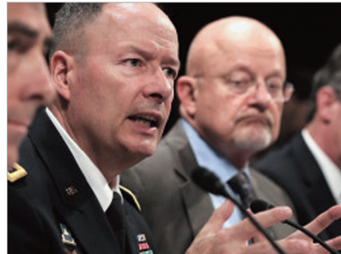
კეიტ ალექსანდერი და კეიმს კლევერი

ამერიკის შეერთებული შტატების კონგრესში მოსმენები დაიწყო, რომლის დროსაც სპეცსამსახურების ხელმძღვანელები კანონმდებლებს აბარებენ ანგარიშს ევროპელი მოკავშირეების მიმართ ჯაშუშობისა და ამერიკის მოქალაქეების მონაცემების უკანონო შეგროვების საკითხზე.