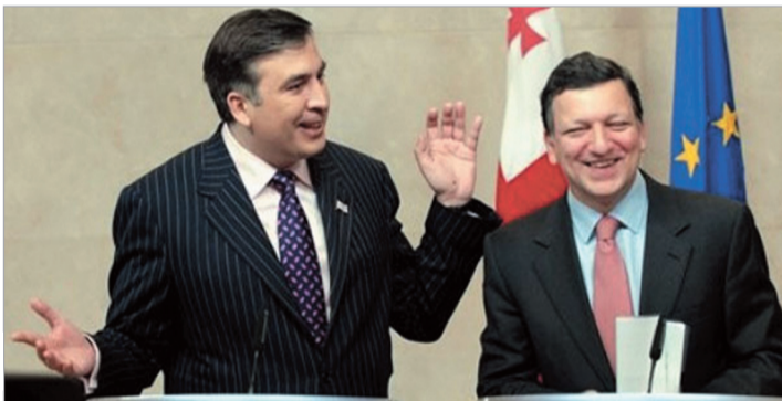
ბაზრძილაძე მ-6 გვირგვინი

მიხეილ სააკაშვილი ბრიუსელში ევროკომისიის პრეზიდენტ ჟოზე მანუელ ბაროზუს შეხვდა.