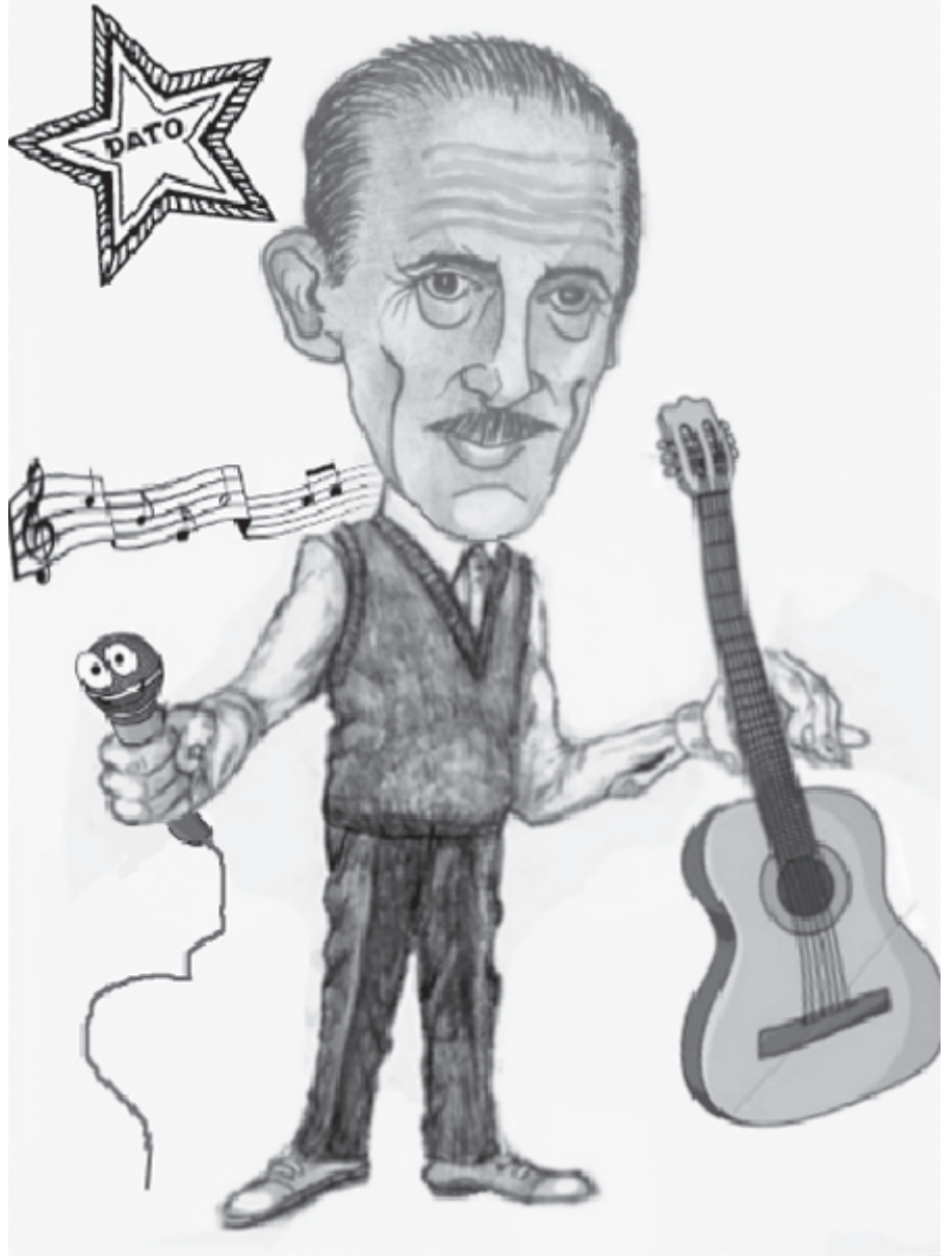
ნახევარი საუკუნე, სიმღერაში ვაატარე, შენი დახვეწილი ტემპრიო, სამტრედია გაახარე.

სპორტულ ღონისძიებაში ჩართულები იყვნენ პოლიციისა და პატრულის თანამშრომლები, მობილიზებული გახლდათ სასწრაფო სამედიცინო დახმარების ბრიგადა.