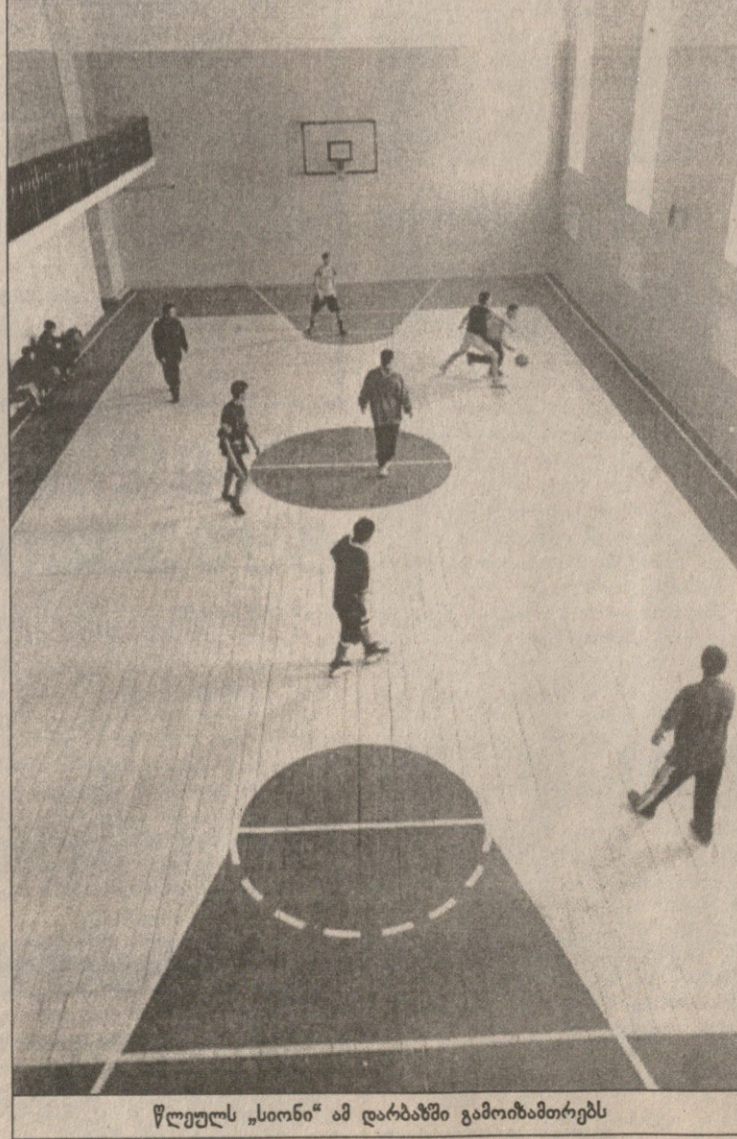
წლეულს „სიონი“ ამ დარბაზში გამოიბამთრებს

ამ გუნდის მთავარი ღირსება ის არის, რომ ფიტილულოს და ბევრისგან არაფრით გამოჩრეულს მრისხანე ავტორიტეტი აქვს ჩვენში. „სიონიან“ ყველას უჭირს, ბოლნისში გამარჯვება გმირობის ტოლფასია, რაც ერთეულების ხვედრია. ამ ქალაქიდან ბევრი სახელოვანი გამოიზრუნებულა გასარებული და კმაყოფილი მოპოვებული ერთი ქულით. ზურაბ ჯაფარიძე: „ბოლნისში ძირითადად სდასაკლეთ საქართველოდან