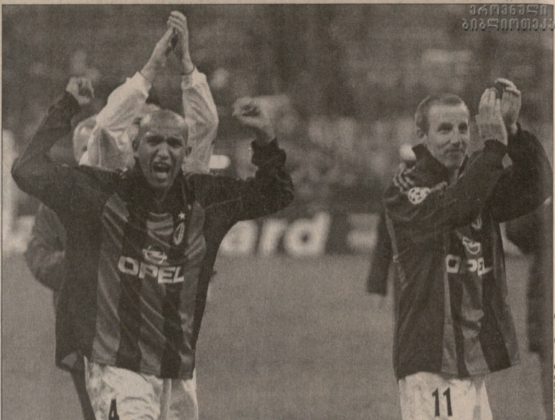
H ჯგუფი. დანიმ, ლუს ენრიკემ (ქვემოთ) და ბარსელონამ თურქები არ დაინდეს, თუმცა მათი ბედი მილანში გადაწყდა...