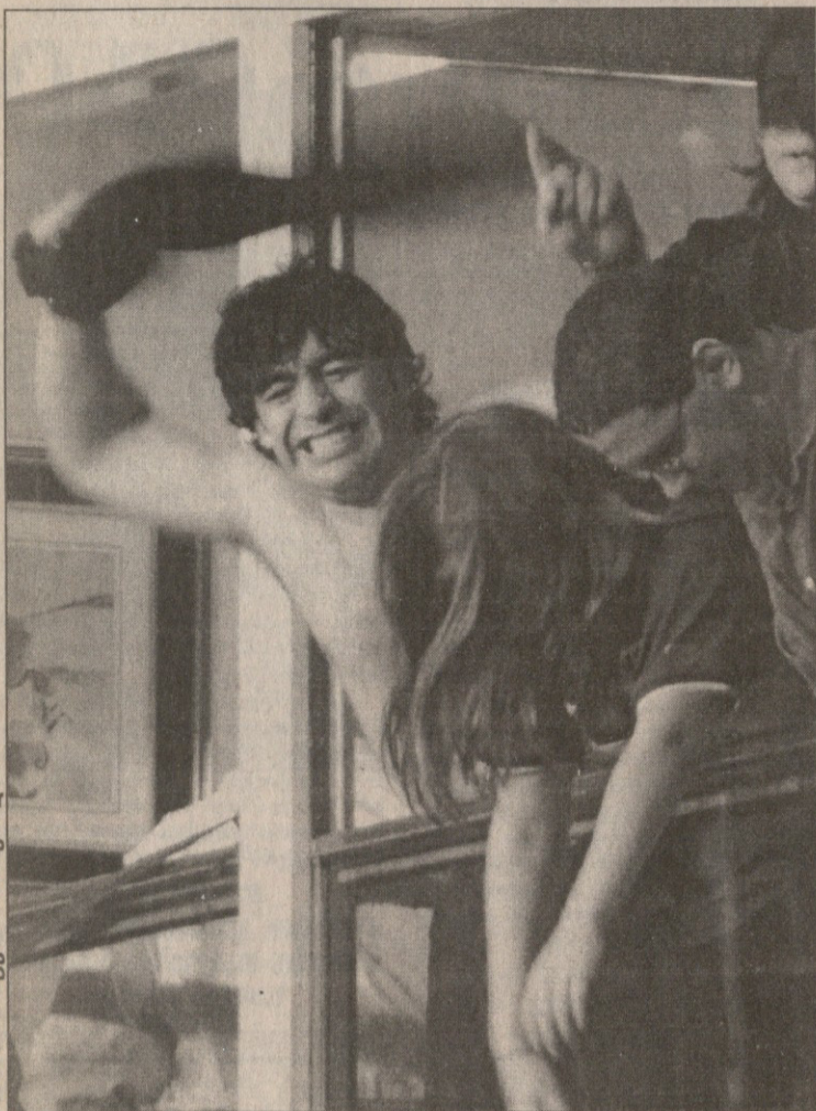
REUTERS ბუნონს აირენსიდან

ესპანურად, თან არგენტინული აქცენტით, ნამდვილად არ ვიცით, როგორაა ეს მადლიანი ქართული ფრაზა, მაგრამ დიეგო მარადონამ, მისმა ქალიშვილმა ჯანიამ და ერთმაც გაურკვეველმა კაცმა სწორედ ეს ამოიძახეს, როდესაც დიეგოს ყოფილმა გუნდმა „ბოკა ხუნიორსმა“ ბრაზილიური „ატლეტიკო მინეიროს“ კართან აშკარა შესაძლებლობა ვერ გამოიყენა. თამაში 2:2 დამთავრდა და მერკოსურის თასის ნახევარფინალში „ატლეტიკო მინეიროს“ გავიდა, რადგან მას პირველი მატჩი მოგებულნი ჰქონდა.