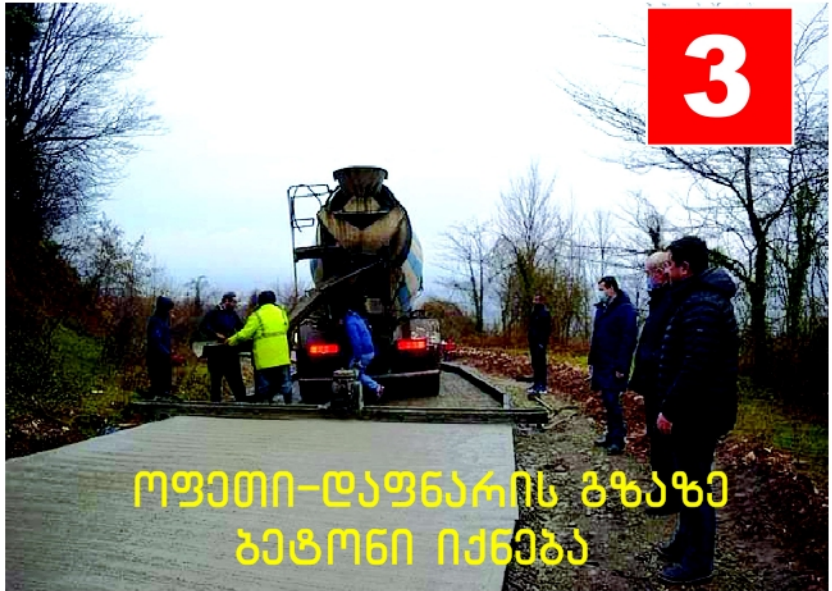
3 ოუთი-ლაუნარის გზაზე ბეტონი იქნება