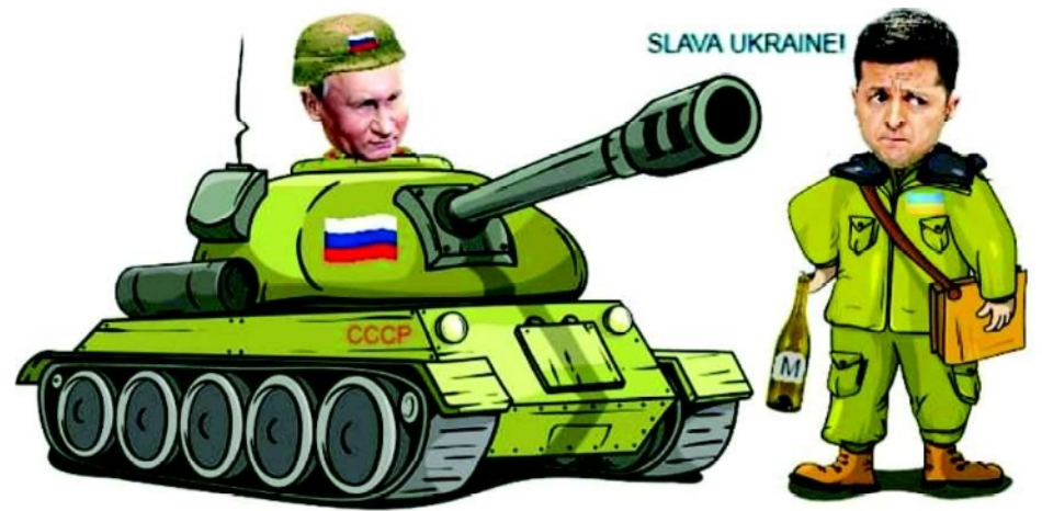
მოლოტოვის კოქტეილის უპირატესობა