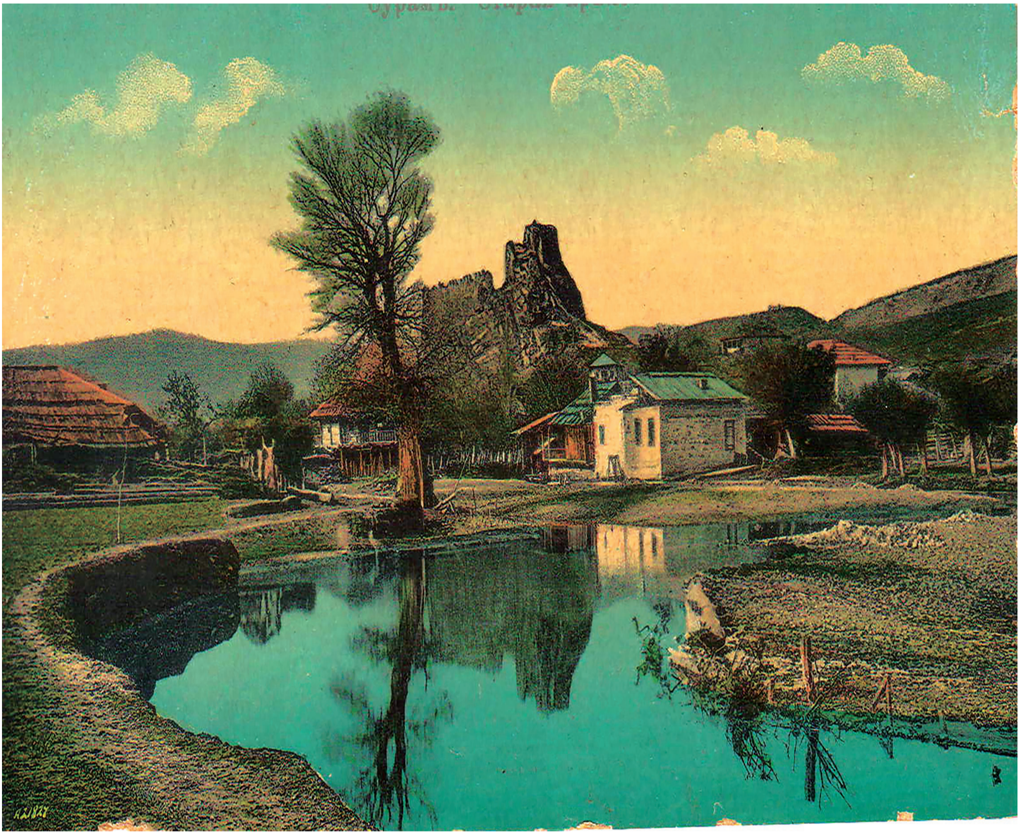
ხაშურის მუნიციპალიტეტის ისტორიული ღირსშესანიშნაობები. სურამის ციხე. მე-19 საუკუნის შუა წლების ფოტო.