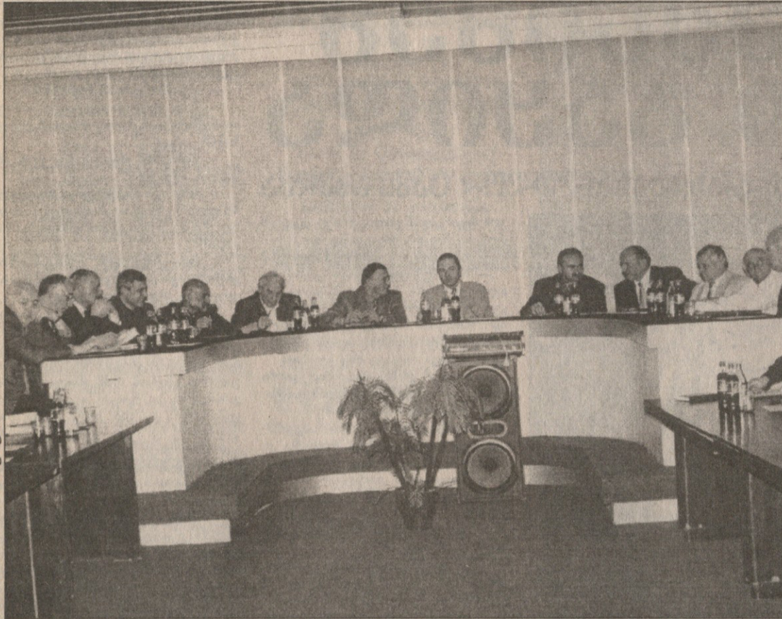
სფფ-ის აღმასკომის შეხვედრა სსრკ-ს საკარტოვების სპორტის სახელმწიფო დეპარტამენტში უმისპინძლა