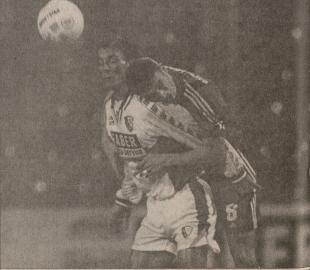
ბოხუმელმა მარო მარინმა თავისი პეტ თრეიტ მთელი „ლევერკუზენი“ ისევე გაასაგათა, როგორც ბორის ფიგოცინი (16)