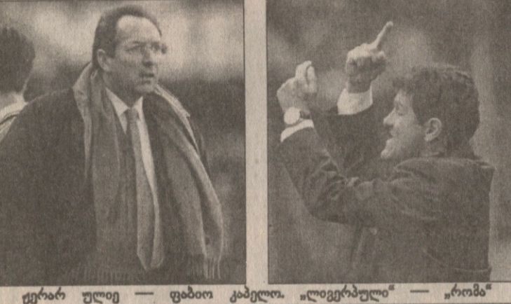
მეორე გუნდი — ფაბიო კაპელო. „ლივერპული“ — „რომა“.

ბურთალოს რაიონული თასის ფინალი. აპოლონი (საბურთალოს რაიონი) — ნანტი (საფრანგეთი). აპოლონი 1-0 გაიმარჯვა. მატჩი მარტის 15-ს ჩატარდა. აპოლონი გასწავლა ნანტის ბრძოლა. ნანტი კარგად იმუშავა, მაგრამ აპოლონი მძლიერად იმუშავა და გაიმარჯვა. ნანტი მატჩის დიდ ნაწილს მარტის 22-ს გაიმარჯვა. აპოლონი კარგად იმუშავა და გაიმარჯვა. აპოლონი მატჩის დიდ ნაწილს მარტის 22-ს გაიმარჯვა.