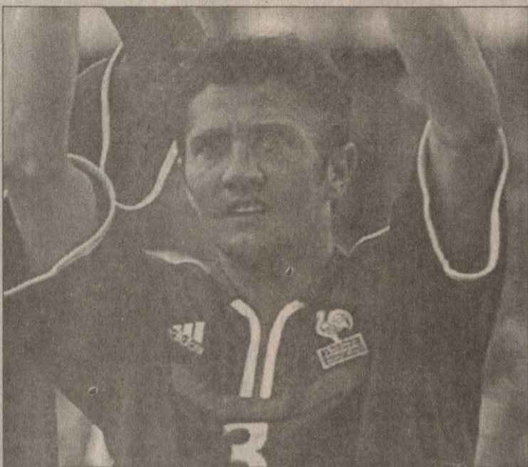
ბიქსენტიე ლიზარაზუსთვის საფრანგეთის ნაკრებში თავიანთი ძვირი სიახლოვნება

ფეხბურთელის უსაფრთხოების უზრუნველსაყოფად ზომები უკვე მივიღეთო, განაცხადებს ფრანგმა და ვერმანელმა პოლიციელებმა.