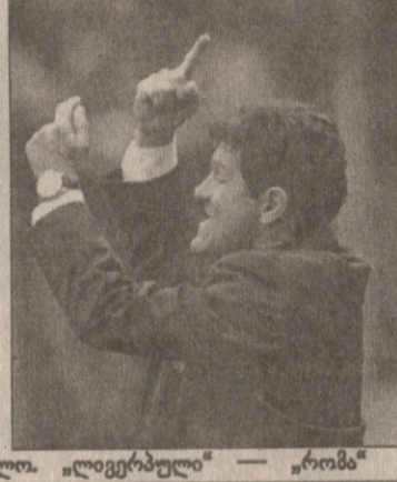
მეორე გუნდი — ფაბიო კაპელო. „ლივერპული“ — „რომა“.

ბურთალოს რაიონული თასის ფინალი. აპოლონი (საბურთალოს რაიონი) — ნანტი (საფრანგეთი). აპოლონი 1-0 გაიმარჯვა. მატჩი მარტის 15-ს ჩატარდა. აპოლონი გასწავლა ნანტის ბრძოლა. ნანტი კარგად იმუშავა, მაგრამ აპოლონი მძლიერად იმუშავა და გაიმარჯვა. ნანტი მატჩის დიდ ნაწილს მარტის 22-ს გაიმარჯვა. აპოლონი კარგად იმუშავა და გაიმარჯვა. აპოლონი მატჩის დიდ ნაწილს მარტის 22-ს გაიმარჯვა.