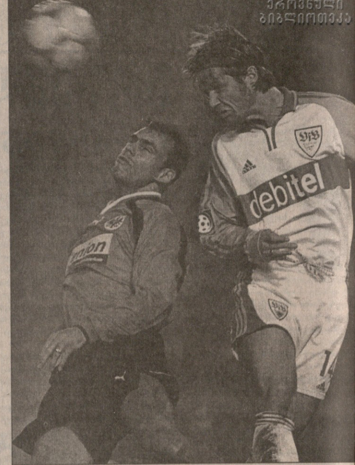
შტუტგარტი — ბორუსია მენჩენგენი 2:0. შტუტგარტი 4:1 ინტერსტი.

ბერლინი. შტუტგარტი (გერმანია) — 2 ბორუსია მენჩენგენი (გერმანია). შტუტგარტი 2-0 გაიმარჯვა. ბორუსია მენჩენგენი კარგად იმუშავა, მაგრამ შტუტგარტი მძლიერად იმუშავა და გაიმარჯვა. შტუტგარტი მატჩის დიდ ნაწილს მარტის 15-ს გაიმარჯვა.