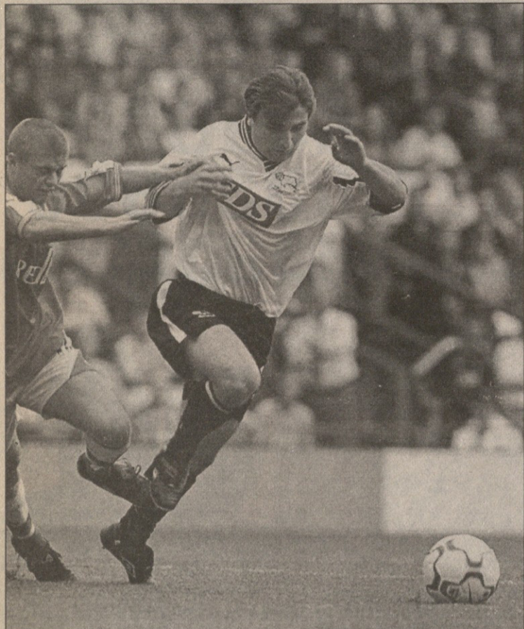
გიორგი ქინქლაძე ხელახლა სამკურნალო გახდა

საქართველოს ნაკრების და ინგლისის „დერბის“ ნახევარმცველი გიორგი ქინქლაძე კვლავ ტრავმირებულია და ამჟამად ნემსებით მკურნალობს.