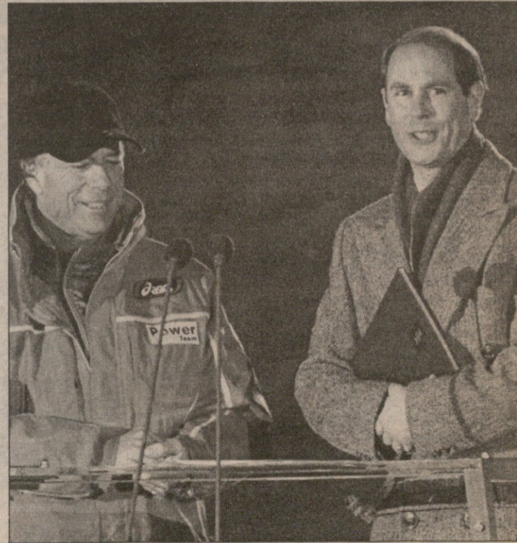
სანტ ანტონიდან

სარბიელი საორტული გაჯეთი გამოიცვამა 1990 წლის 28 დეკემბრიდან გამოდის სამშაბათს, ოთხშაბათს, ხუთშაბათს, პარასკეპს და შაბათს