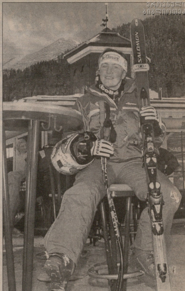
სანტ ანტონიდან