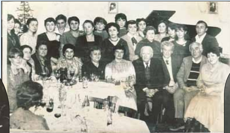
ღუშეთის სამუსიკო სკოლის პედაგოგიური კოლექტივი 1984წ.