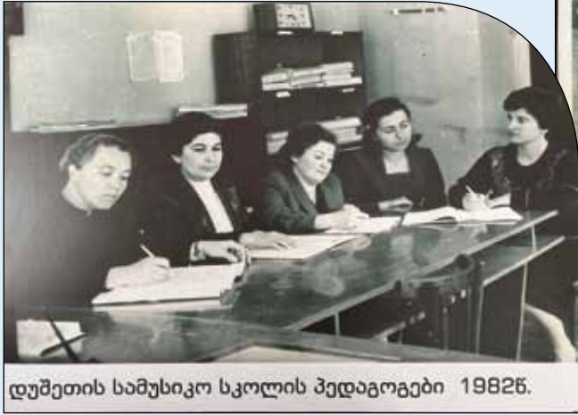
ღუშეთის სამუსიკო სკოლის პედაგოგები 1982წ.