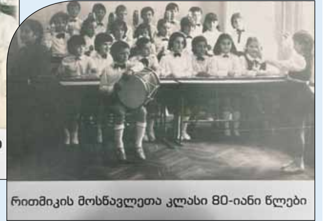
რითმიკის მოსწავლეთა კლასი 80-იანი წლები