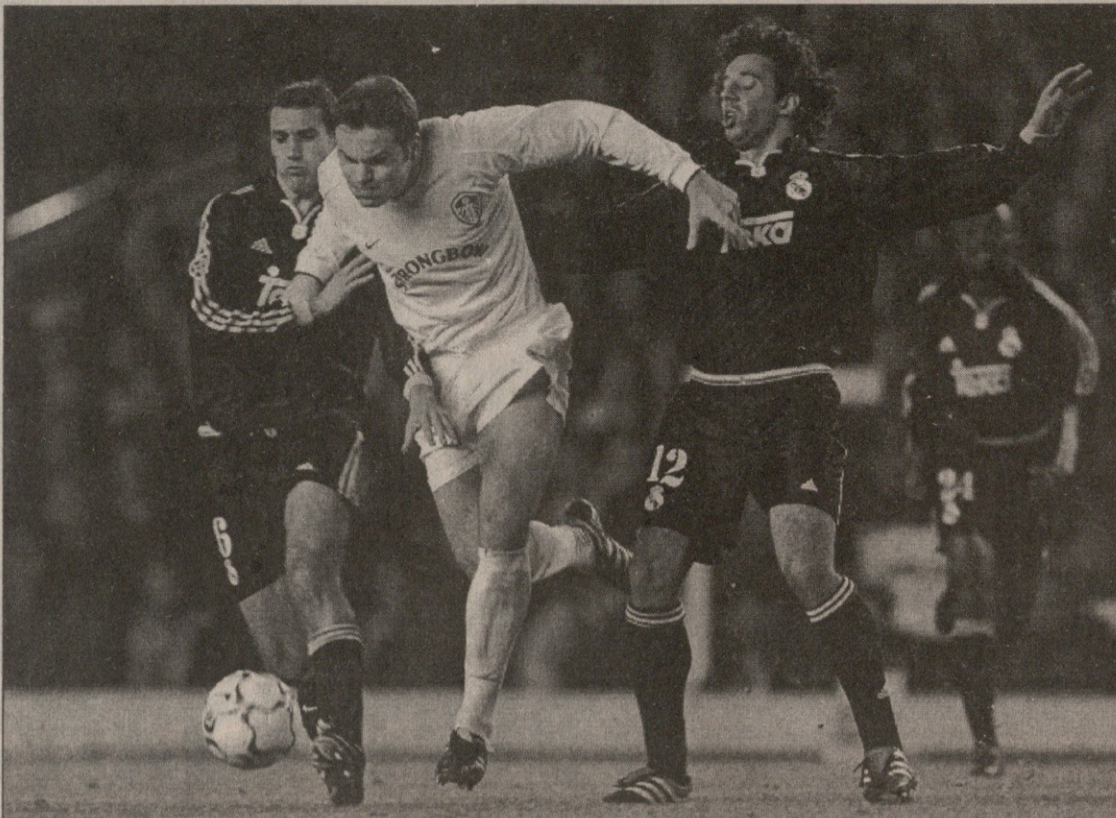
„სანტიago ბერნაბეუ“, იმ მოტივაციის — ამბოხს ლიდრული მარცხი (შუაში)